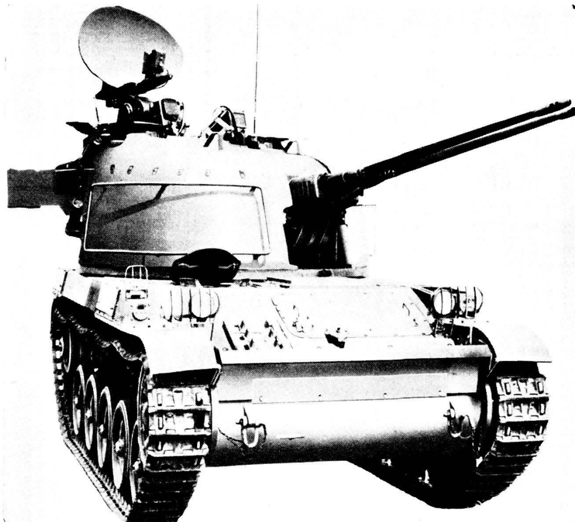
Cannone antiaereo calibro 30 mm, a due canne su scafo AMX 13 dotato di radar direttore di tiro, Occhio nero.