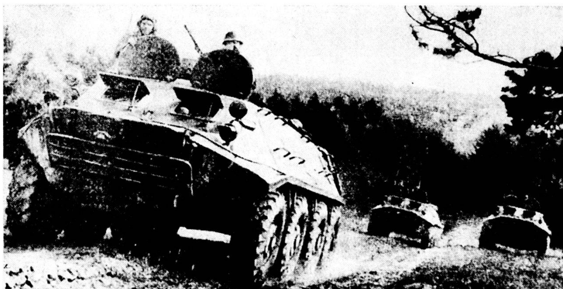
Veicoli blindati di accompagnamento BTR 60 in marcia di avvicinamento

nei blindati è possibile soltanto se il difensore viene bloccato con l'impiego di armi A e se la difesa ac del battaglione di fronte è stata completamente annientata. Il combattimento in profondità e l'inseguimento offrono altre possibilità per attaccare restando nei blindati. Un impiego corretto dei veicoli blindati di trasporto nella difesa rafforza la capacità difensiva. La soluzione d'adottare a seconda delle circostanze dipende evidentemente dal terreno. Occorrerebbe curare d'impiegare questi veicoli blindati 200 m e più dietro la LAR, lungo gli assi di penetrazione, all'orlo dei pendii od interrati. Da queste posizioni essi possono intensificare il fuoco fiancheggiante e battere zone d'ombra, garantire la copertura dei granatieri ed essere posti di riposo durante le pause del combattimento. Singoli veicoli possono pure essere immediatamente impiegati nei caposaldi di sezione oppure stare in agguato nelle profondità del sistema difensivo. La difesa deve essere condotta in modo attivo e mobile (contrattacchi, avanzate, protezione dal fuoco delle armi A nemiche). Mette conto sempre ricordare che i veicoli blindati per il trasporto di truppa sono particolarmente efficaci nella difesa se sono impiegati come mezzo di trasporto mobile e non come sorgente di fuoco statica.