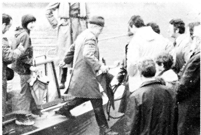
Il pubblico sbarca da un motoscafo della linea che collega le due zone d'interesse della manifestazione.