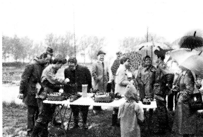
Vivo interesse tra il pubblico hanno suscitato le stazioni radio in dotazione della truppa.