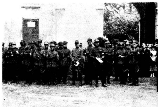
I benemeriti commissari