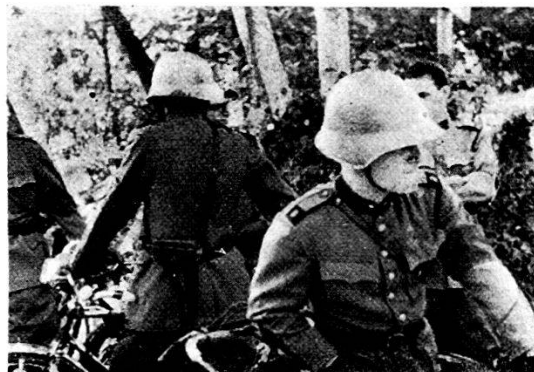
I ciclisti aspettano...