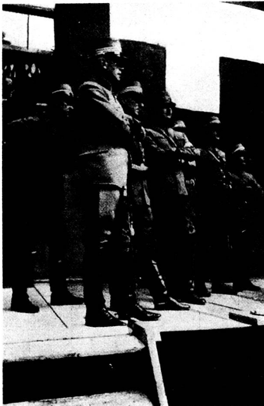
Le autorità militari

Poi la notte comincia a rompersi nella luce e nella pace. Altra gente è per la strada ed i motori per riscaldarsi cominciano a battere. Alcuni cantano, altri urlano. È una diana robusta, nella quale sta male l'epiculeo che nel caldo pigiama si sporge alla finestra per invocare in nome dei regolamenti silenzio per il suo pigro sonno. Ma quel giorno di regolamenti per quella giovinezza che vuol cantare tutta la sua vita non ve ne sono come non ve ne sarebbero domani quando dovrebbe farne sacrificio.