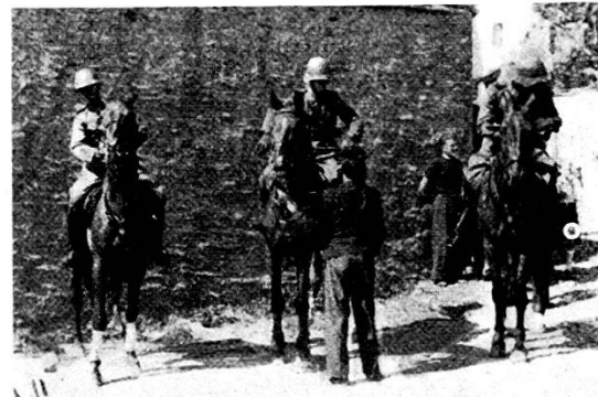
I cavalieri sono in sella...