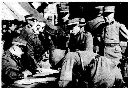
Al controllo di arrivo