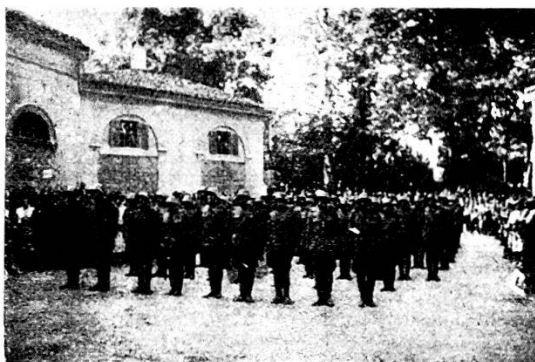
Il robusto quadrato dei concorrenti