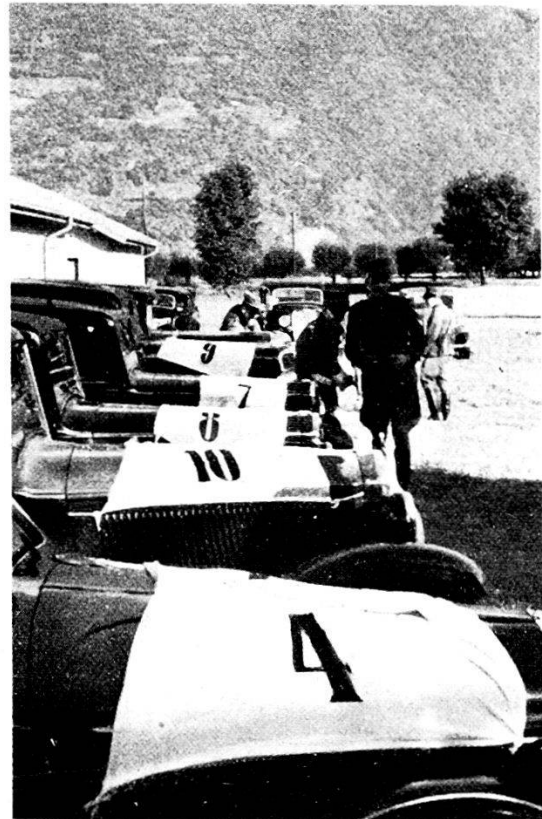
Le macchine ben allineate...