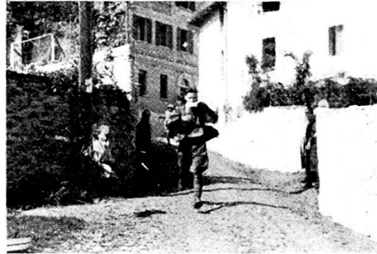
I ten Forni e Lanzi arrivano a Torricella