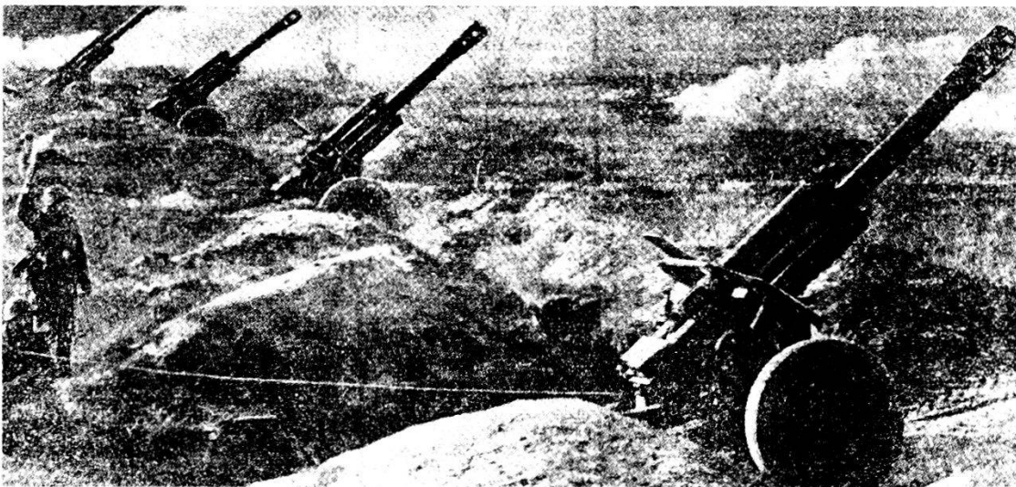
Obici 152 mm, M 1943 (D-1) in posizione. Pezzo con canna corta e freno di bocca pluriforato. Ritenuto obice di medie prestazioni.

Sono particolarmente pericolosi i fiumi ed i torrenti di montagna ed i letti asciutti di questi corsi d'acqua; sovente possono diventar pericolosi anche semplici infossamenti. Ma il terreno di montagna non costituisce unicamente ostacolo all'esplorazione: al contrario, spesso offre condizioni favorevoli per l'impiego degli esploratori. In particolare, esso permette di infiltrarsi nel dispositivo avversario senza farsi notare, di impiegare pattuglie e di eseguire imboscate e colpi di mano. Naturalmente, con le caratteristiche del terreno devono essere tenute in considerazione anche quelle climatiche. L'esperienza e l'istruzione di montagna approfondita, sono importanti premesse per il successo.