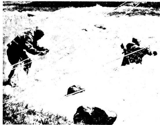
L'istruzione individuale è dura e realistica. Il soldato sovietico l'accetta di buon grado. Qui, il passaggio di un fiume di montagna.