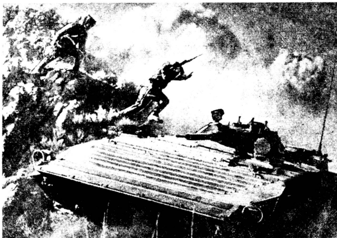
Carri armati granatieri in montagna. Sovente sono più importanti come veicoli di trasporto che come mezzi di combattimento a fuoco.

Un attacco in montagna ha luogo di solito dopo contatto diretto con il nemico. Normalmente esso viene eseguito in diverse direzioni, principalmente lungo strade, cammini e sentieri, valli e creste di montagna. Le difficoltà del terreno rendono spesso necessario cercare la decisione non frontalmente, bensì con azioni