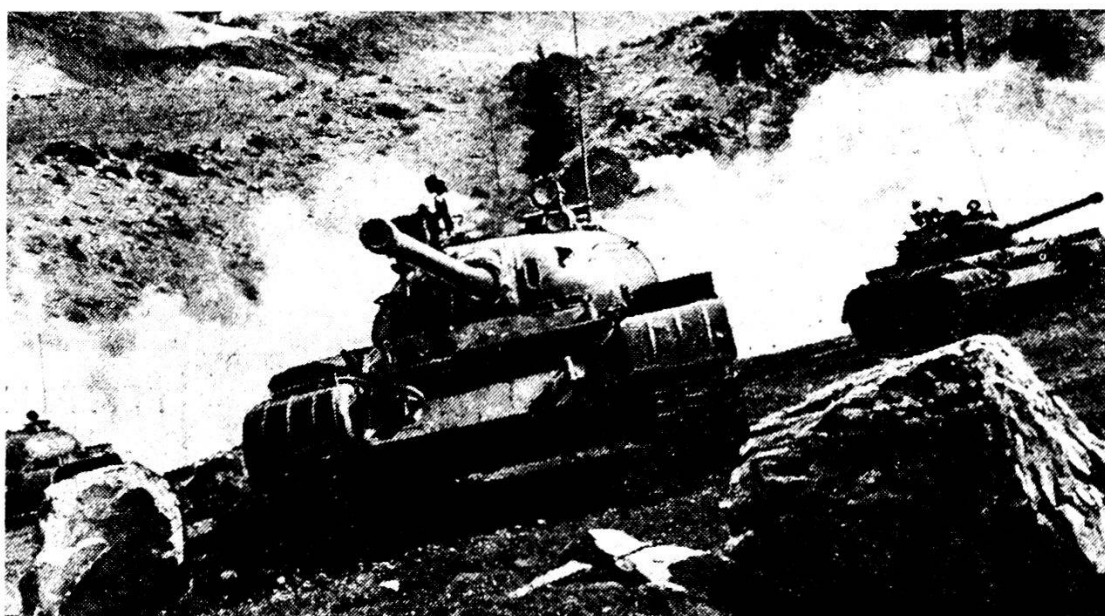
Carri armati T-62 in impiego in montagna.

In montagna la possibilità di impiegare i carri in modo efficace sono molto limitate. La montagna detta l'impiego ai due contendenti senza grandi differenze. Bisogna però ancora una volta sottolineare che i Russi sono maestri nell'improvvisazione, che cercano dappertutto la sorpresa e che raggiungono grossi risultati con l'uso dei più svariati trucchi e artifici.