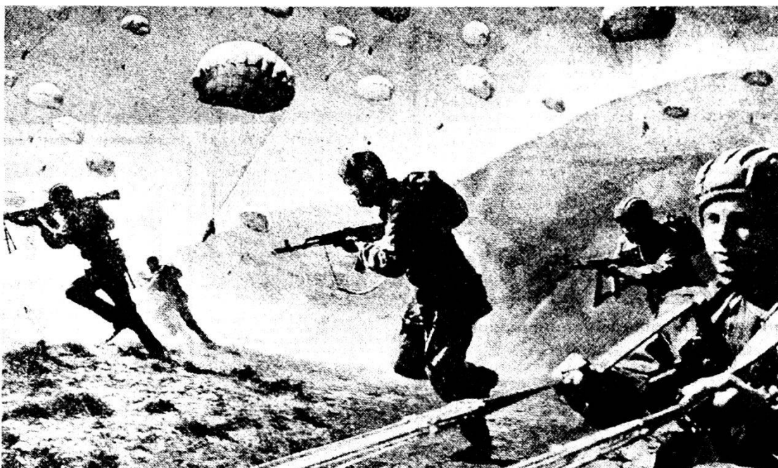
Paracadutisti atterrano alle spalle del nemico. Lo sfruttamento della terza dimensione, favorita dall'aumento degli elicotteri, dà un nuovo aspetto al combattimento di montagna.