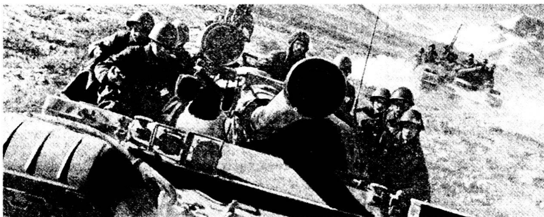
Fuc mot trasportati su carri armati T-62. Questo sistema di trasporto viene usato molto dai Russi: risparmia forze per l'attacco. I fuc mot si trovano qui nella fase di avvicinamento.

Nella scelta e nella costruzione dei posti di osservazione bisogna avere ingegnosità ed applicare tutti gli stratagemmi che il terreno permette . È favorevole alloggiare gli organi di osservazione in caverne, crepacci e sui contropendii in vicinanza delle creste e delle cime. Gli uomini devono essere capaci di costruire ra-