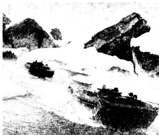
Fuc mot superano un valico con i loro carri armati granatieri BMP.