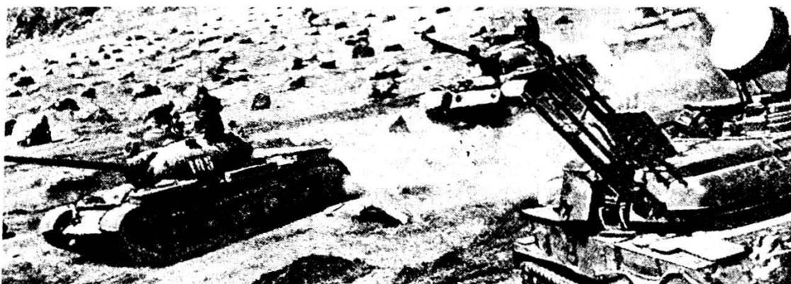
Una unità di carri armati, equipaggiati con carri T-55, in marcia in montagna. La difesa contraerea è fatta con ZSU-23-4.

Il compito dei pionieri nel combattimento di montagna è molto variato. Sovente la velocità d'attacco non dipende solo dalla resistenza del nemico, bensì anche dalle condizioni delle strade, dall'entità degli ostacoli e dalla rapidità con cui gli stessi possono essere superati. E qui i pionieri hanno una importanza determinante . Essi esplorano le vie di progressione, aprono brecce nei campi minati, riparano tratti stradali, rinforzano ponti, preparano passaggi di fiumi e di gole, costruiscono posizioni per le armi, posti di combattimento e di osservazione, eseguono lavori di mascheramento ecc. I pionieri fanno parte degli organi di esplorazione, vengono attribuiti ai distaccamenti di aggiramento e trovano impiego ovunque.