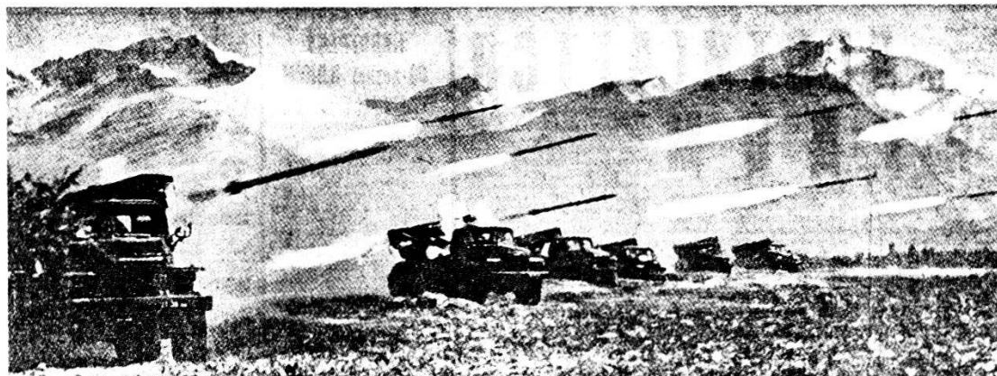
Lanciarazzi multipli 122 mm - BM_21 in posizione di tiro. Portata 11 km.

I distaccamenti di aggiramento richiedono molto tempo perciò devono essere impiegati con relativo anticipo. La loro azione a sorpresa diventa sovente determinante per il successo generale. Non è però facile penetrare nel dispositivo di difesa senza farsi notare dal nemico, anche se esistono brecce e intervalli; fanno parte dell'azione di aggiramento, attacchi simulati e fuochi di sorpresa per di-