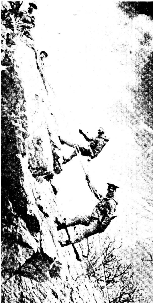
Istruzione di alta montagna di fuc mot sovietici.

Missioni analoghe a quelle dei reparti di avanguardia sono affidate anche a reparti aeroportati . In questo campo ci saranno nel prossimo futuro nuove importanti possibilità, perché il tempo lavora a favore dello sfruttamento della terza dimensione.