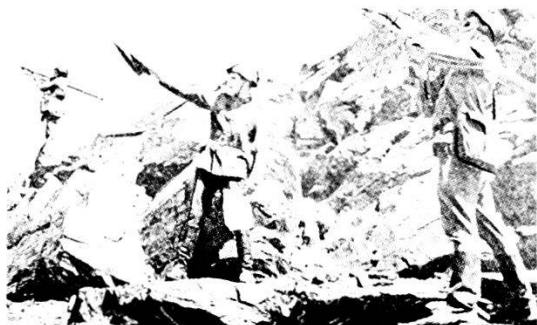
Razzi terra-aria Sa-7 (Grail). Istruzione in montagna. La partenza del razzo avviene con l'arma alla spalla. Altezza massima 3000 m. Velocità Mach 0,7. Impiego solo contro aerei lenti ed elicotteri.

Le difficoltà di osservazione e la situazione che sovente evolve rapidamente, richiedono l'organizzazione di una fitta rete di posti di osservazione installati sui punti dominanti.