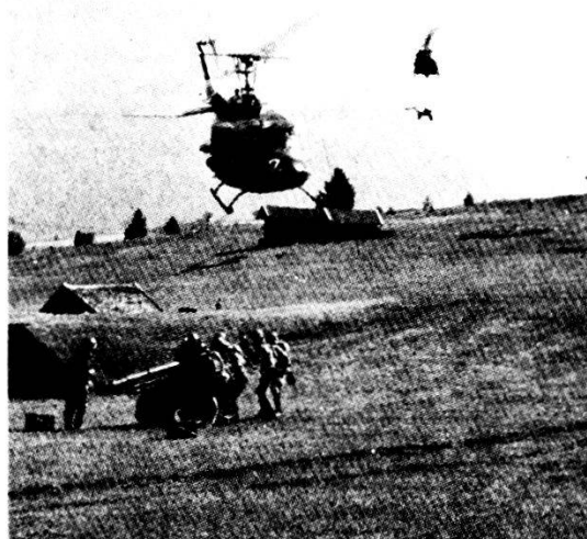
Elicotteri trasportano obici di 122 mm nella vicinanza delle posizioni di tiro.