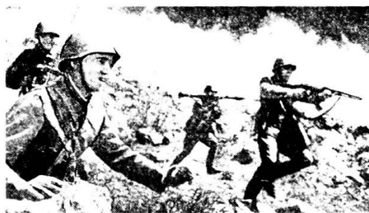
Il nemico viene attaccato alle spalle.