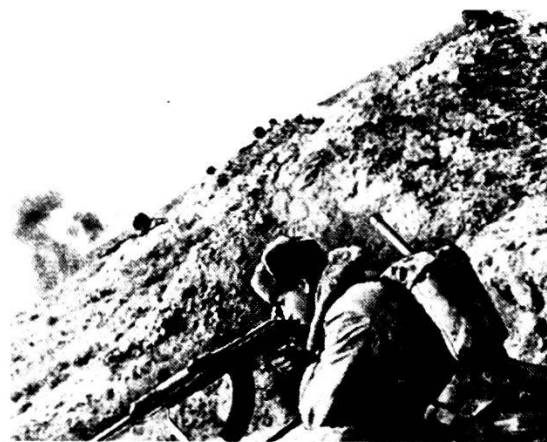
Fuc mot in difesa in montagna. Si esercita molto il tiro dall'alto, ciò che viene sovente criticato da autori militari sovietici.