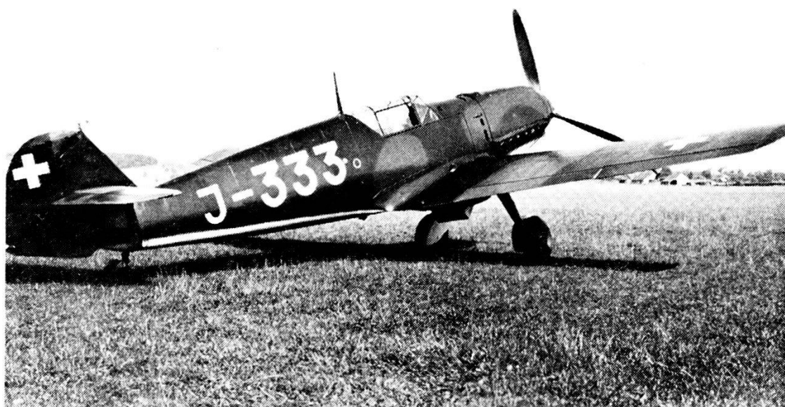
1939 - Messerschmitt Me-109 E - Questi caccia sono restati in servizio dal 1939 al 1948.

Date queste circostanze tecniche e quelle sempre variabili delle vicende belliche, il Comando delle Truppe d'av ricorse all'istituzione dei turni di servizio attenendosi al principio di avere sempre sotto le armi, in numero adeguato, dei Rgt av o anche solo dei Gr av, ma completi del loro Stato maggiore e del relativo materiale (ed effettivi), dei servizi di trasmissione, d'avvistamento e di difesa antiaerea, in modo da potere assicurare e perfezionare la condotta tattica e operativa delle squadriglie continuamente impegnate nel loro compito di sorveglianza e di difesa del nostro spazio aereo.