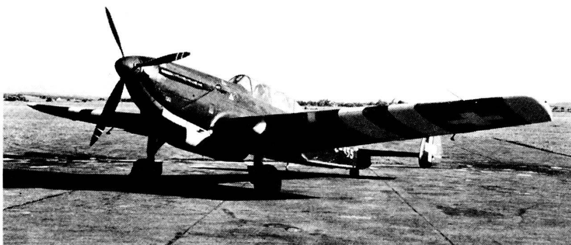
1942 - C-36 - Aereo biposto da caccia, d'intervento al suolo, e di osservazione.

terreno d'atterraggio nel limite geografico permesso dal loro stato o dalla riserva di carburante. Questo nuovo aspetto della guerra aerea ai nostri confini non liberò l'aviazione militare elvetica dal suo compito di fare rispettare la neutralità e nell'ademperlo essa costrinse all'atterraggio sui campi predisposti a tale scopo, 251 aerei, con l'arresto e l'internamento di 1618 uomini dell'equipaggio. Durante il conflitto ci fu anche un avvenimento abbastanza grave da fare temere un intervento armato da parte della Germania e ordinato dallo stesso Hitler, avvenimento che anche se fu indipendente di una qualsiasi azione della nostra aviazione militare ne coinvolse però la sua organizzazione. Il 29 aprile 1944 atterrava a Dübendorf, senza esservi costretto, un prototipo d'aereo destinato a potenziare la caccia notturna tedesca, in grave difficoltà contro i sempre più micidiali attacchi notturni dei bombardieri della R.A.F. (le due aviazioni alleate si erano ripartiti i compiti: di giorno operavano le «fortezze volanti» U.S.A. men-