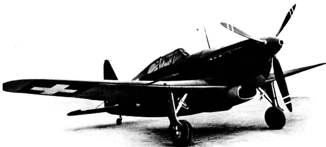
1940 - Morane D-3801, caccia monoposto. Questo aereo è restato in servizio dal 1939 al 1959.