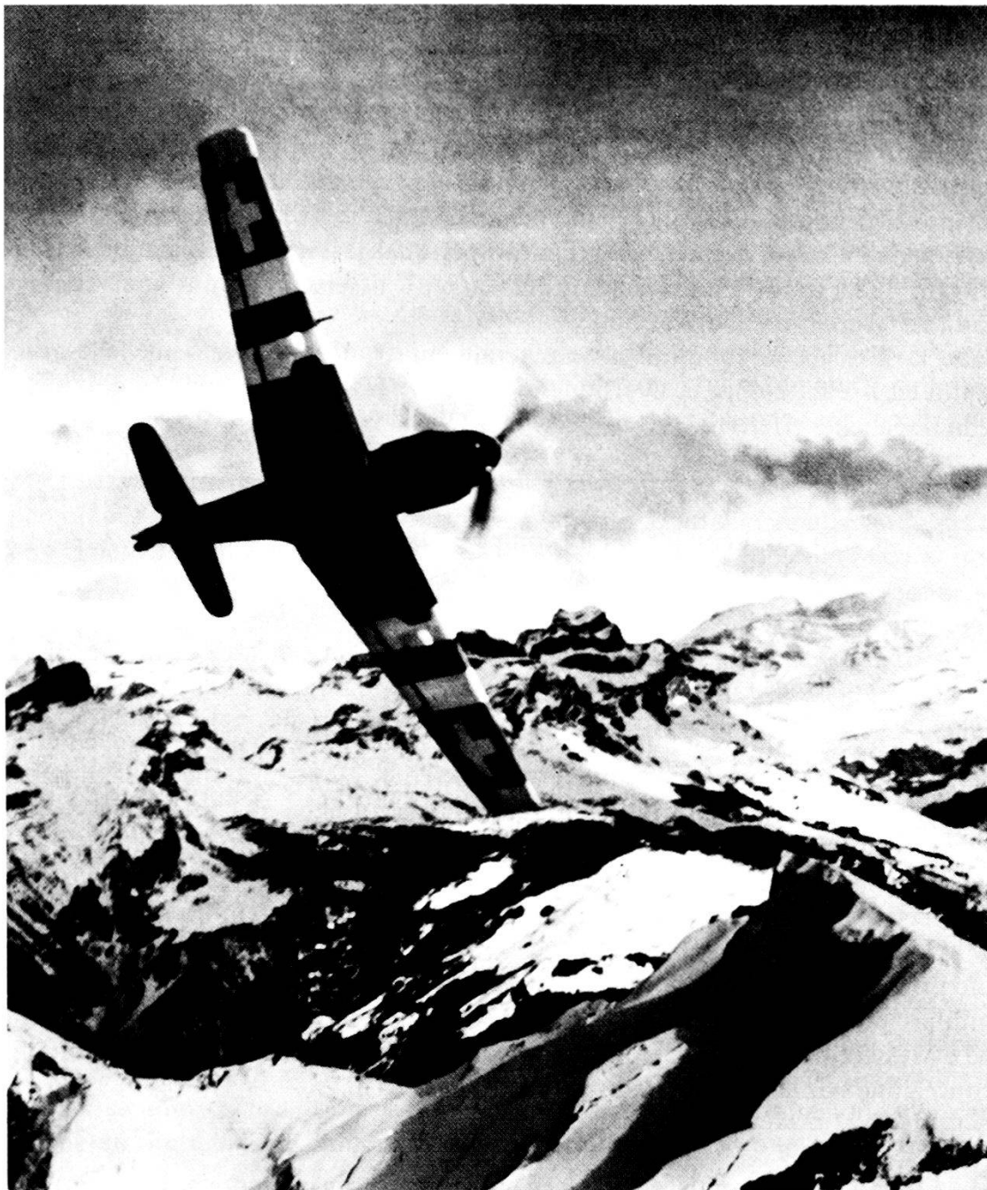
Durante il servizio attivo dal 1939 al 1945 le missioni di combattimento aereo incombevano principalmente ai caccia Messerschmitt Me-109.