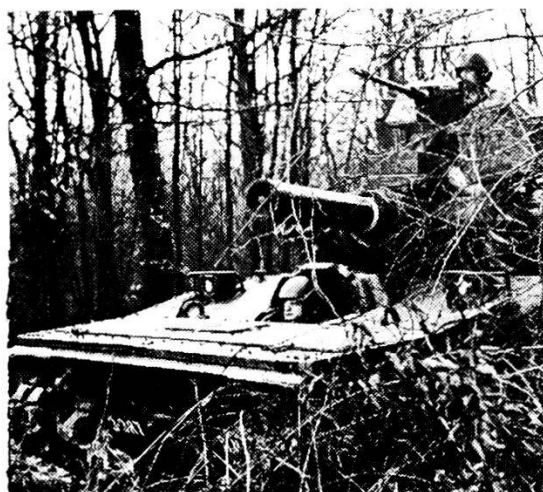
Cavalleria corazzata in posizione al coperto.

è pure all'altezza delle necessità. I sistemi d'armi del tipo «Hawk-Nike-Hercules, Chappararral, Vulcan e Redeye» conferiscono alla difesa contraerea una eccellente efficacia. Il sostegno di combattimento delle truppe del genio è stato alquanto potenziato con la fornitura di moderni mezzi di traghetto. Annualmente circa 90.000 soldati americani — tra cui molti per la prima volta — arrivano in Europa. Essi sono già formati militarmente e possono essere impiegati quali soldati di valore completo . Nell'ambito dei reparti viene continua-