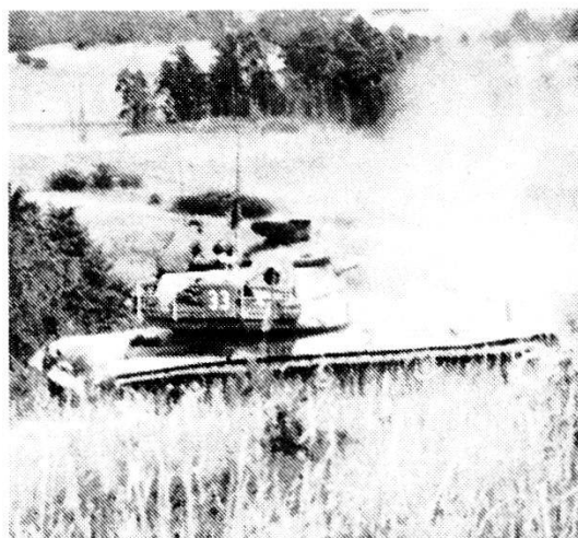
Carro armato da combattimento M-60 in posizione di tiro.