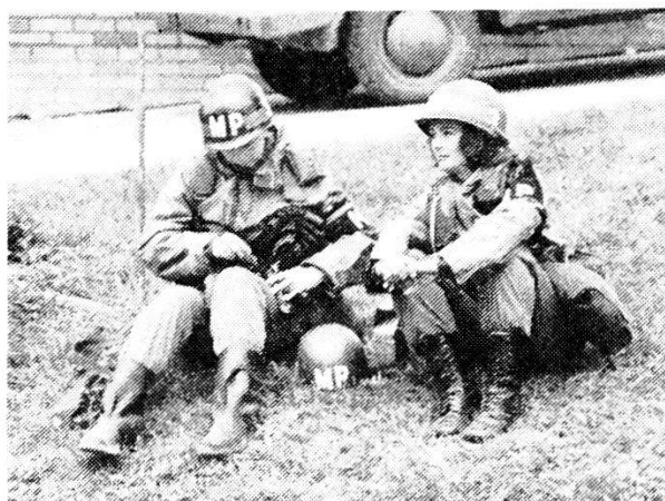
Polizia militare del corpo femminile in tenuta da combattimento.