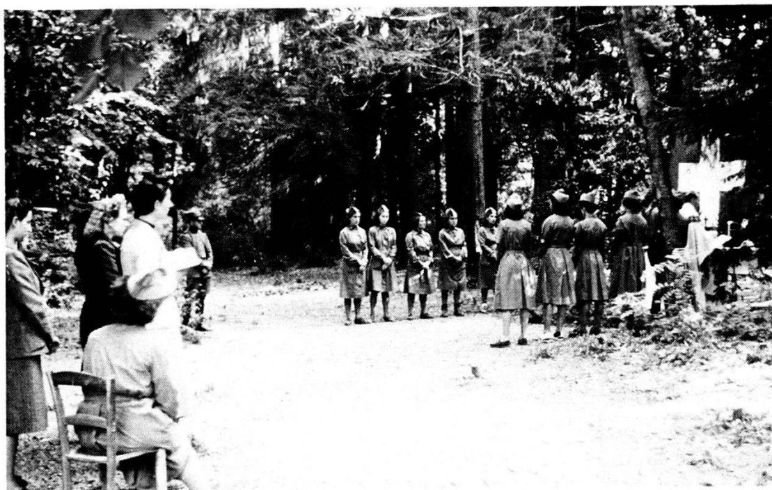
8.9.1940 Castello di Trevano: Messa da campo.