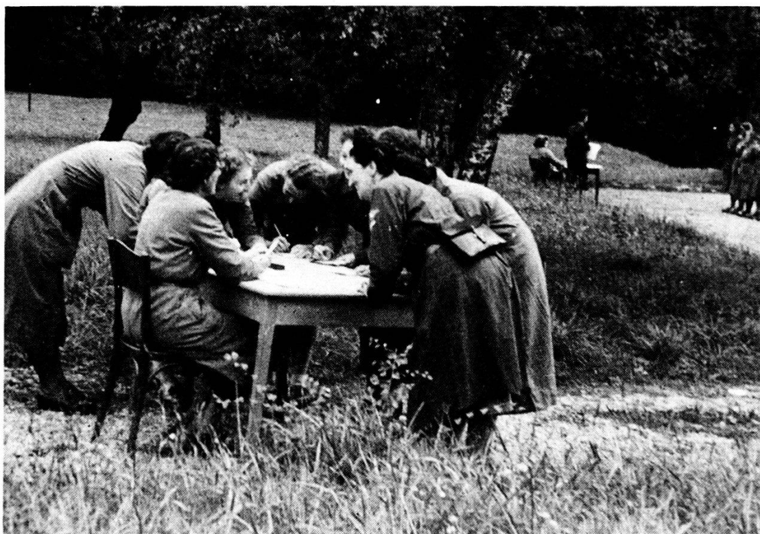
1948 Arenenberg: SCF ticinesi alla corsa di orientamento.

Il 1. agosto 1941 s'iniziò la pubblicazione del giornale SCF. Dal 1944 il giornale