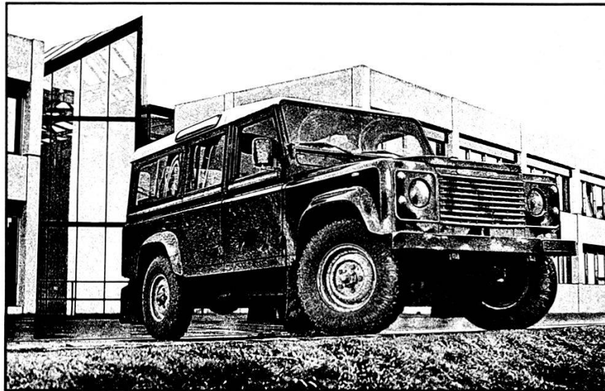
Tabler & Tabler AG ASW 8953 Dietikon

L'origine del conforto risiede in un telaio super. Guida e molleggio degli assali rigidi sono severamente separati. Guida longitudinale con bracci longitudinali. Davanti guida trasversale con barra Panhard, dietro braccio trasversale triangolare centrale. Molleggio per mezzo di molle elicoidali ad azione progressiva e ammortizzatori a telescopio. Regolazione precisa, sportivamente rigida. Trazione integrale permanente standard. E due forzuti motori mossi senza piombo forniscono un'energica spinta. Uno è di 3,5 litri, un propulsore V8 di lega leggera capace di 115 CV a 4000 g/m e 251 Nm a 2500 g/m. E non è che abbia una gran sete! Però, quando è permesso, trotta a 115 km l'ora. Poi c'è il nuovo 2,5 litri con 4 cilindri in linea , 84 CV a 4000 g/m e 181 Nm a 2000 g/m.