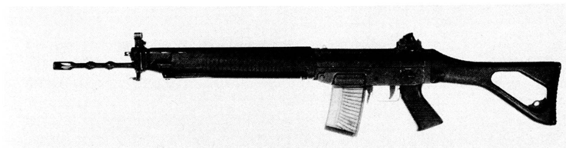
Fucile d'assalto mod 90