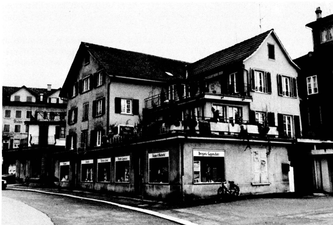
Casa di Hotze a Richterswil.

di San Sebastiano che solatia si erge lungo i margini della Linth nascosti da folta vegetazione palustre; addossato alla carrozzabile, si erge un annoso cippo funerario brunito dal tempo, recintato da una bassa balaustra di ferro. Quel piccolo monumento, eretto dalla pietà di due amici del Feldmaresciallo, sta a indicare il punto esatto ove caddero Hotze e Plunket.