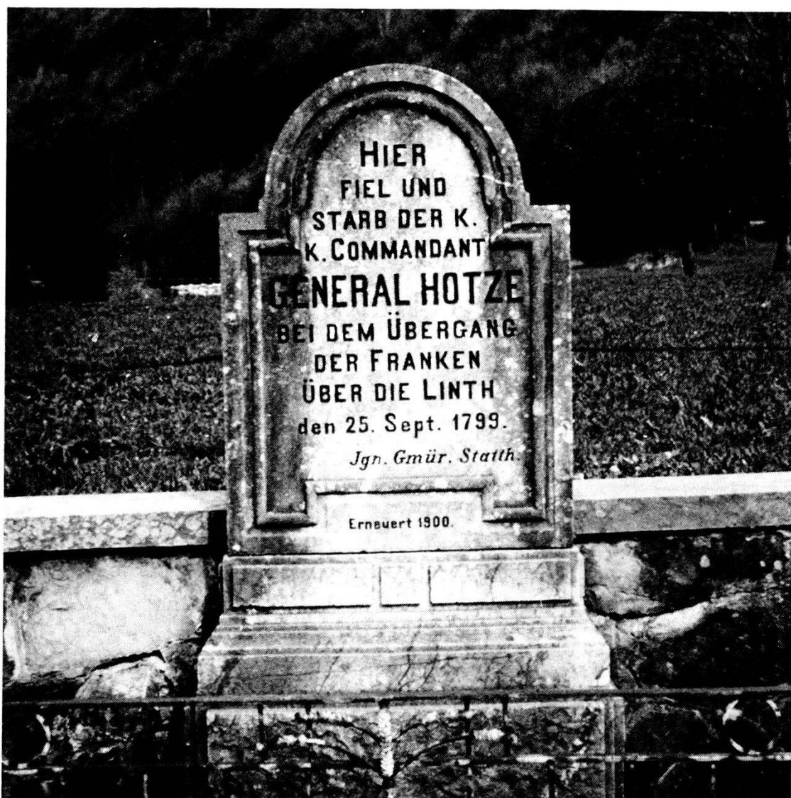
Cippo funerario eretto ove cadde Hotze c/o cappella di S. Sebastiano sul tratto di strada Schänis-Weesen.

facessero la loro comparsa in Svizzera, dopo animatissime discussioni, il Consiglio Aulico permise all'arciduca di distaccare, a provvisorio sostegno della piccola armata di Korsakoff, la piccola armata austriaca del Feldmaresciallo Hotze, forte di circa 24.000 uomini, col compito di presidiare le rive del lago di Zurigo e il tratto della Linth.