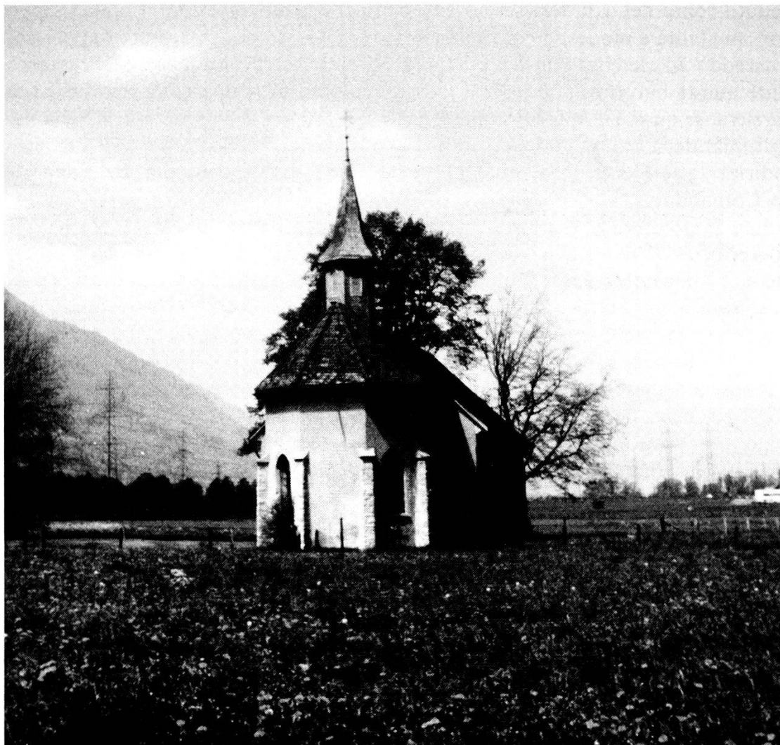
La triste e solatia cappelletta di S. Sebastiano c/o Schänis (GL).

l'imperatore gli affidò suo nipote, l'arciduca Francesco, divenuto poi imperatore d'Austria, che sotto la guida di Hotze fece le prime esperienze militari. Promosso maggior generale, Hotze si distinse nel 1793 nell'attacco delle linee del Weissenburg, poi al Reno, alla testa del corpo d'armata di Würmser, ottenendo in quei fatti d'arme, con due anni di anticipo la Croce di Maria Teresa. Luogotenente generale nel 1796, batté clamorosamente le truppe francesi di Bernardotte nella battaglia di Würzburg, riprendendo la piazzaforte, facilitando all'arciduca Carlo