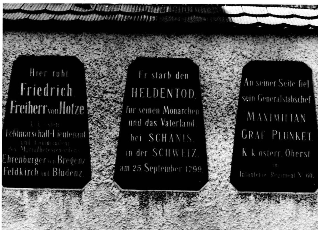
Monumento funerario eretto alla memoria di Hotze e Plunket sito nel cimitero militare di Bregenz (Austria).

e da Korsakoff, riuscirono a sventare un piano accuratamente preparato ai loro danni, battendo a tempo di record, il Russo a Zurigo e Hotze sulla Linth. Per battere Hotze, i Francesi furono favoriti dalla sua tragica morte avvenuta all'alba del 25, quando ancora le forze austriache non si erano impegnate a fronteggiare l'avversario, per cui, questa battaglia, senza Hotze andò perduta in partenza. Ma cos'era avvenuto sul fronte della Linth tenuto dal Feldmaresciallo? All'Alba di quel brumoso e freddo mattino del 25 settembre, seguito da una piccola scorta a cavallo, il Feldmaresciallo volle effettuare un giro di ricognizione lungo il tratto della Linth che da Schänis conduce a Weesen. Temerariamente, volle avventurarsi nei pressi della cappella di San Sebastiano, a 200 metri dall'abitato, località in cui, si diceva, fossero nascosti alcuni Francesi che nottetempo erano riusciti a guadagnare la sponda nemica. Assalito in un baleno da un piccolo contingente di fucilieri nemici nascosti nel