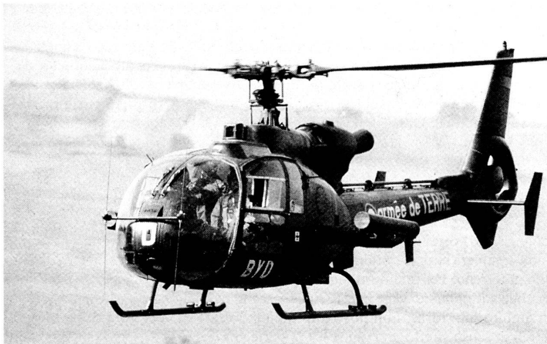
Un elicottero «Gazelle», della 4 a Divisione aeromobile, armato di missili HOT.

re ha sempre un ruolo importante perché se l'importanza della Sanità Militare è predominante in un dispositivo di questo tipo, rimangono tuttavia missioni di protezione e trasporto, e l'Esercito ha gli uomini per proteggere, e i veicoli e gli elicotteri per trasportare. Possiamo quindi affermare che non è la natura delle missioni globali cui partecipa l'Armée de Terre che è cambiata, bensì il loro peso. Possiamo vedere chiaramente come alcune di esse vadano assumendo una maggiore importanza; in termini di priorità si assiste oggi a un riequilibrio fra le forze destinate a operare oltremare e quelle orientate verso un conflitto di maggiore entità, estremamente protette. Ma ciò non porta a una drastica riduzione del complesso di forze.