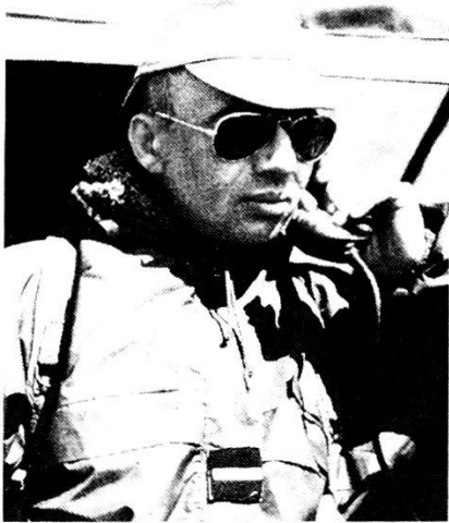
Un sottufficiale dell'Armée de Terre; i Quadri rappresentano l'investimento principale dell'Esercito francese.

Alla luce della Guerra del Golfo ci si è domandati se non fosse il caso di «appesantire» la FAR. Quali saranno le misure necessarie, oltre alla creazione dei comandi interforze? La FAR manterrà in futuro il suo nome e la sua fisionomia?