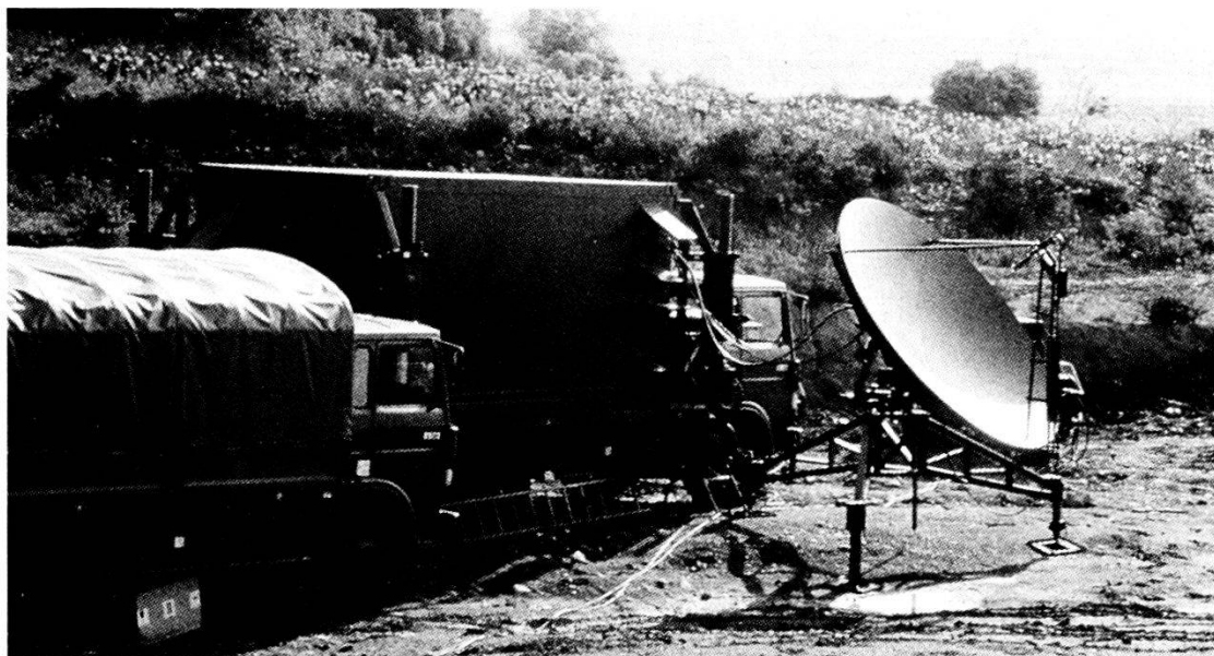
L'antenna di un sistema di comunicazioni via satellite; le trasmissioni sono un altro punto di forza dell'Armée de Terre.

Il criterio di universalità verrà mantenuto per coloro disponibili entro i tre o quattro anni successivi al servizio militare, ma per gli altri faremo ricorso a specialisti o volontari come fanno i britannici e i canadesi.