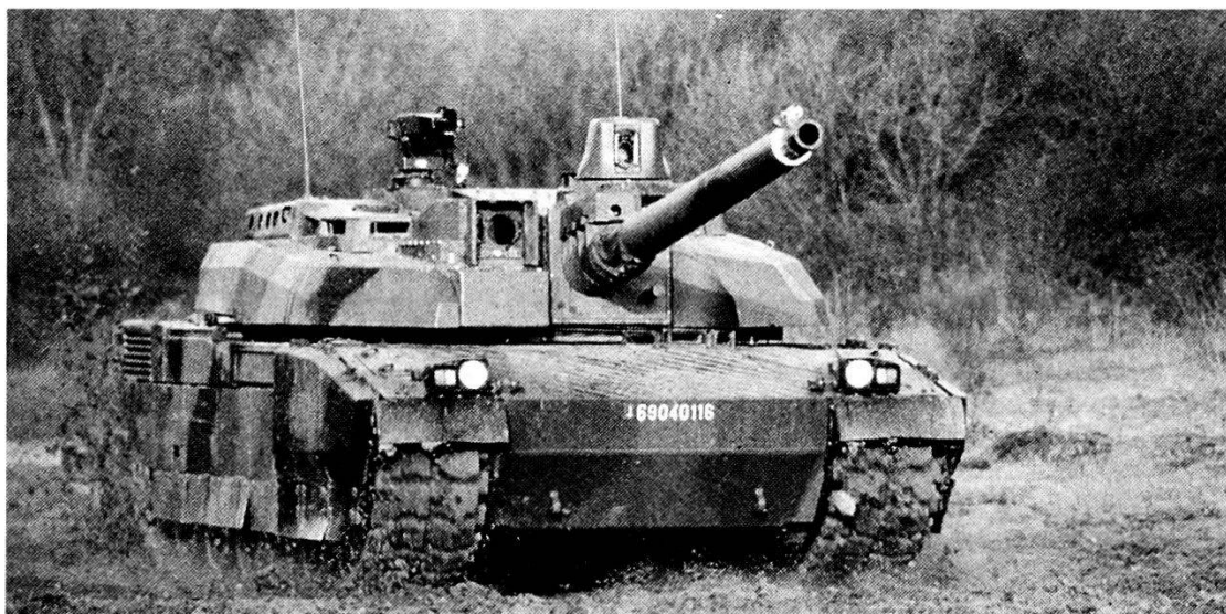
Un carro «Leclerc» in movimento, oltre alle caratteristiche tipiche dei carri, questo mezzo racchiude, anche quelle tipiche di un centro C31.

specialisti di cui si ha bisogno? Sarebbe forse possibile, ma a condizione di pagarli, e ciò porterebbe a costi eccessivi. Quindi al momento attuale la discussione Esercito di leva-Esercito di mestiere è un falso problema, si tratta di un falso dibattito. Il problema è quello di sapere quale è la percentuale di personale di leva che ci vuole nelle Forze Armate, e quale è la percentuale di volontari necessaria nei prossimi cinque anni, questo è il vero dibattito. Non si può scegliere una soluzione radicale. Ciò non esclude che gli strateghi pensino a lungo termine, dato che a mio parere tutti sono complementari, coloro che devono pensare al futuro lontano e coloro che, come me, devono vedere lontano ma preoccuparsi principalmente di gestire il futuro a medio termine e soprattutto il presente.