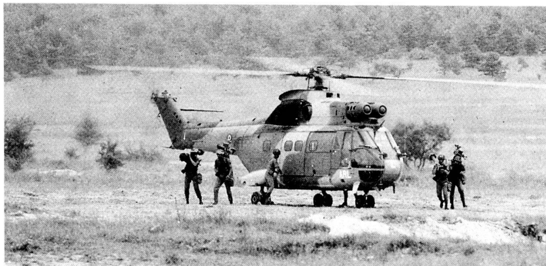
Una squadra dotata di sistema «Mistral» sbarca da un elicottero «Puma» dell'ALAT; Francia ed Italia collaborano strettamente nel settore controaerei.

daliero che avevamo schierato. Pensiamo che le donne siano necessarie nelle Forze Armate, ma che vi siano dei limiti da non superare, limiti che abbiamo fissato nelle unità di prima linea a un massimo di quattro donne per cento uomini, in quelle di supporto a sette ogni cento. D'altro canto questi limiti non sono particolarmente necessari, dato che al momento il numero di volontarie non è sufficiente a raggiungerli. Quindi direi che l'Armée de Terre è aperta alle donne; quelle che si arruolano nelle nostre fila sono molto competitive. Personalmente sono assolutamente soddisfatto delle donne che si trovano oggi nell'Armée de Terre, e ne apprezzo molto il lavoro e la disponibilità.