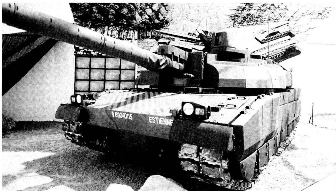
Uno degli esemplari del carro «Leclerc» durante le prove prima della sua entrata in servizio prevista per i prossimi anni.

Per noi dunque l'esperienza della Brigata franco-tedesca è stata molto positiva. Si è trattato di un laboratorio e siamo sicuri che se creeremo un Corpo d'Armata europeo questo funzionerà altrettanto bene.