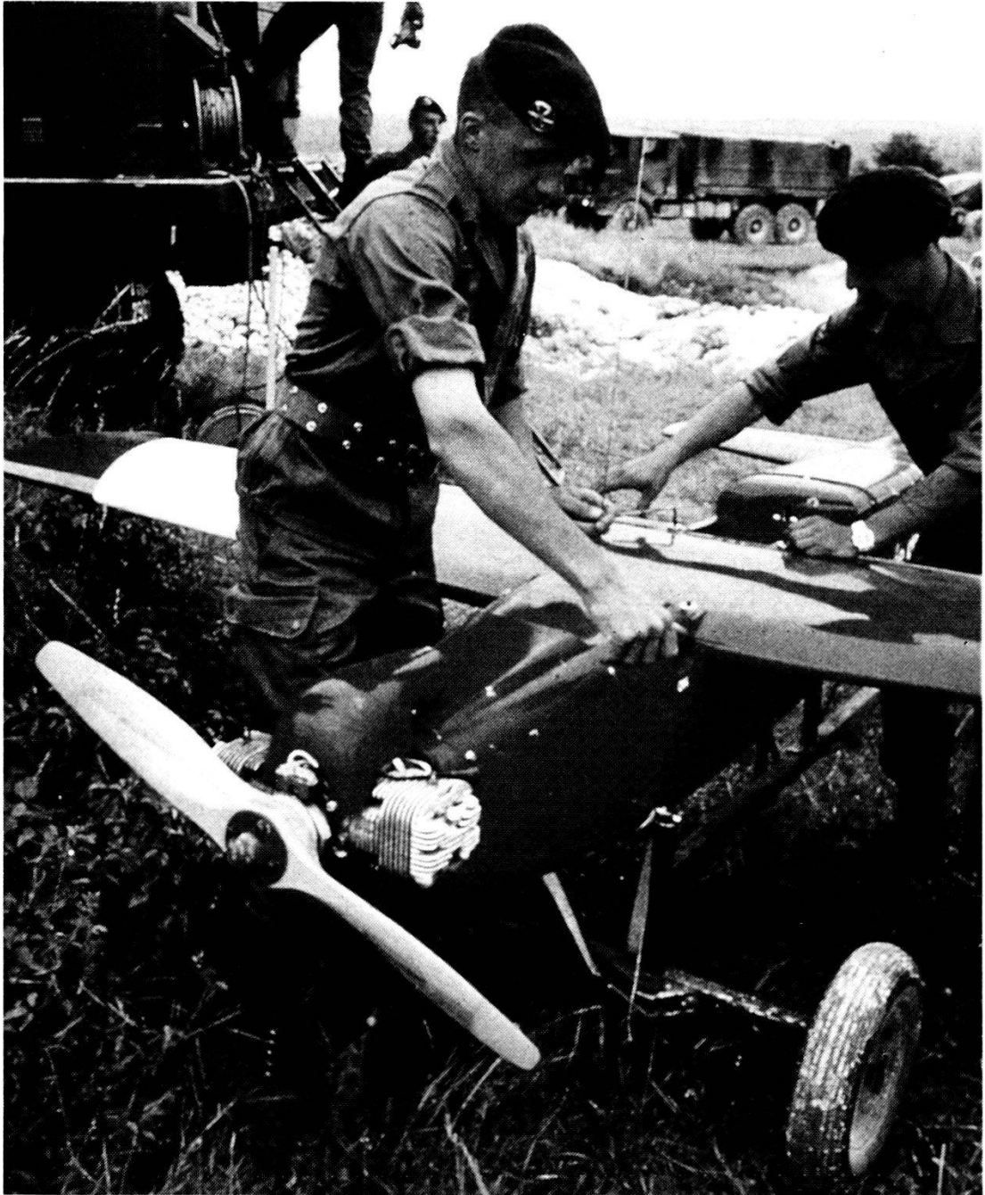
Un mini-RPV in dotazione ai reparti di artiglieria francesi; l'artiglieria è l'Arma che per prima ha iniziato l'opera di ammodernamento.