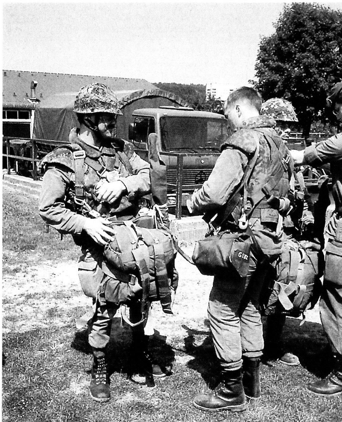
Paracadutisti tedeschi della 27ª Brigata si apprestano al lancio.