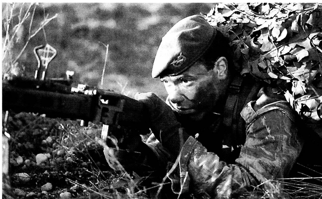
Un paracadutista portoghese in azione con una mitragliatrice MG.

Nel Nord Africa e Medio Oriente non è configurabile un concreto e consistente rischio diretto nei confronti della NATO o uno dei Paesi membri, poiché ciò presuppone una capacità di condurre operazioni su vasta scala che nessuno dei Paesi dell'area al momento detiene. Permane il rischio – come in passato – di atti ostili (attacchi proditori, in particolare mediante vettori missilistici e/o aerei) di valenza più terroristica che militare vera e propria. Nell'area del Golfo Persico persiste – nonostante la recente guerra condotta contro l'Iraq – un alto gradiente di rischio dovuto al costante potenziamento degli strumenti militari di taluni Stati ostili all'Occidente quali, in primo luogo, l'Iran le cui mire egemoniche nella regione sono palesemente manifeste. Al rischio di una offesa diretta all'estremo lembo di