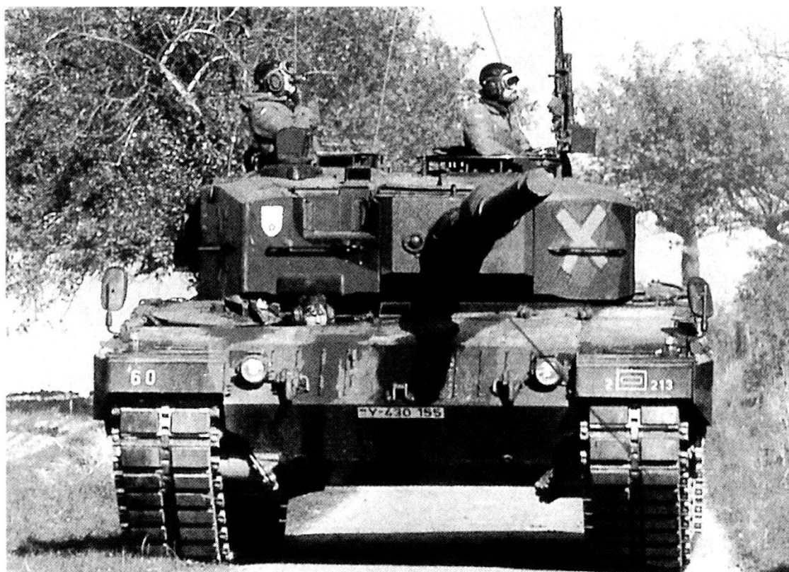
L'equipaggio di un «Leopard» della 7ª Panzerdivision tedesca osserva il terreno circostante.