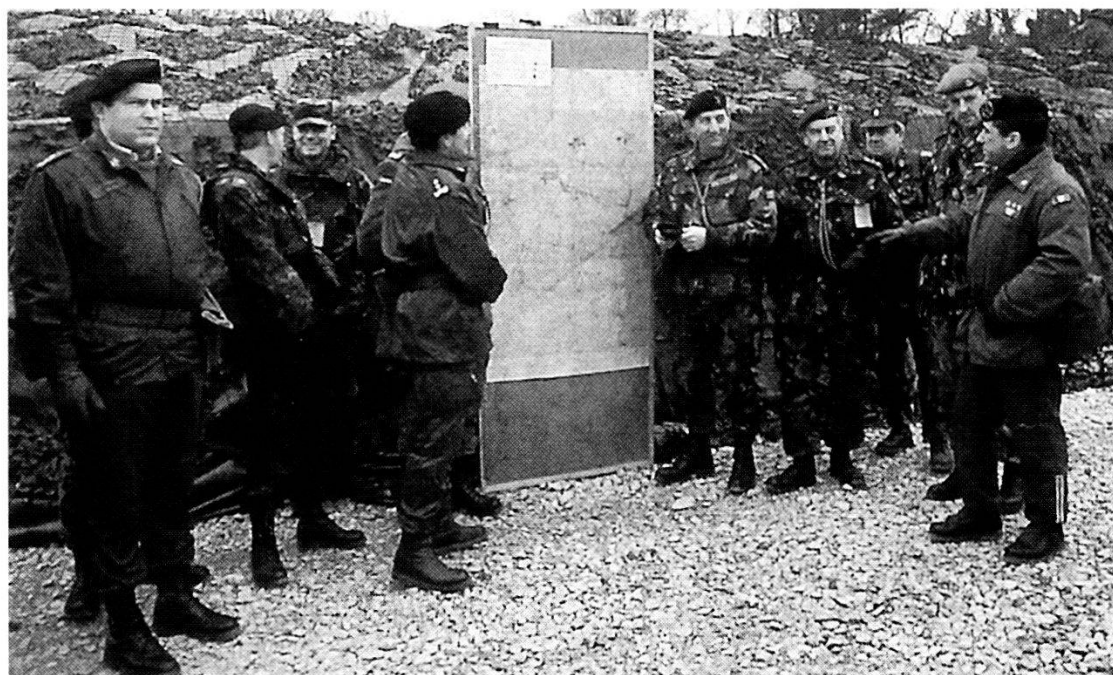
Complessivamente il Comando dell'ACE Rapid Reaction Force annovera rappresentanti di 12 nazioni.