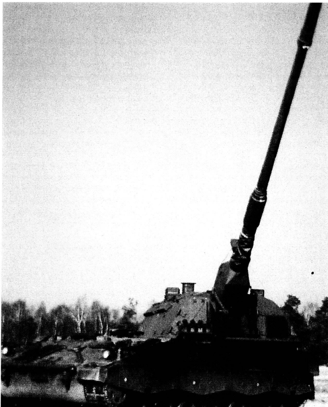
Obice semovente tedesco PzH 2000 «Taurus».