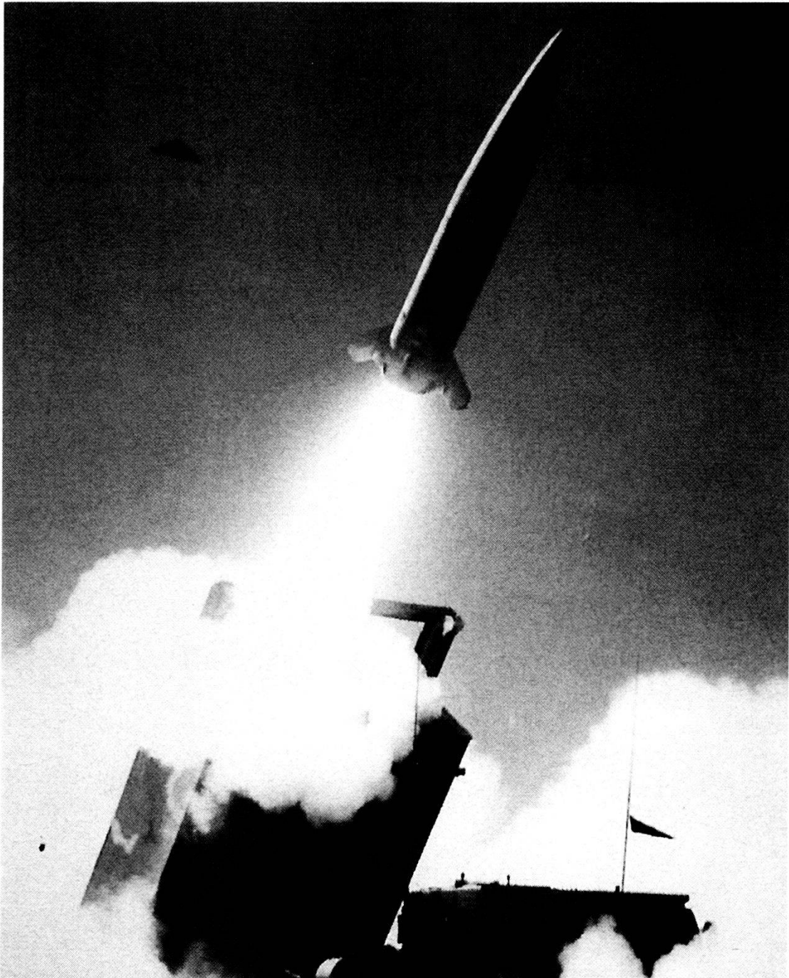
Sistema statunitense ATACMS (Army TACTical).