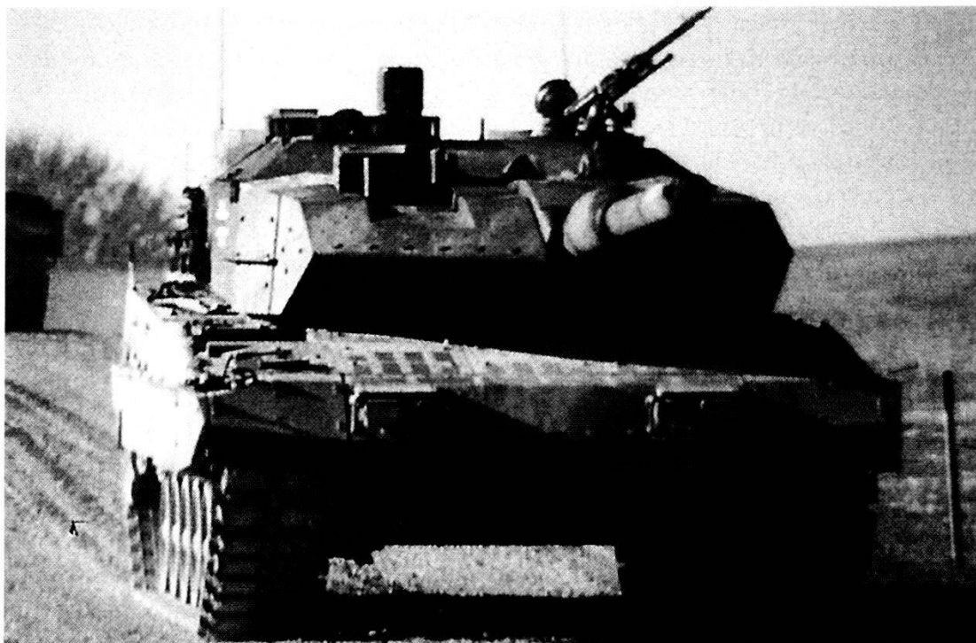
Carro armato Leopard 2 II Improved.

Se la contrapposizione bipolare si è fondamentalemente esaurita, almeno nella concezione che ognuno di noi ha, o ha avuto, della vita politica internazionale di ieri, la necessità di creare un sistema di sicurezza si presenta come una prima importante soluzione per poter affrontare il disordine sistemico che nasce come prodotto politico della guerra fredda. In una realtà in cui le Nazioni Unite stentano, ancora, nel dimostrare una loro concreta capacità decisionale e di intervento risolu-