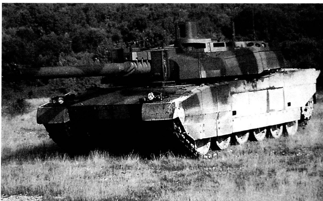
Carro armato «Leclerc» dell'Armée de Terre francese.

La realtà politica europea richiede alla NATO, come si è visto, una ridefinizione