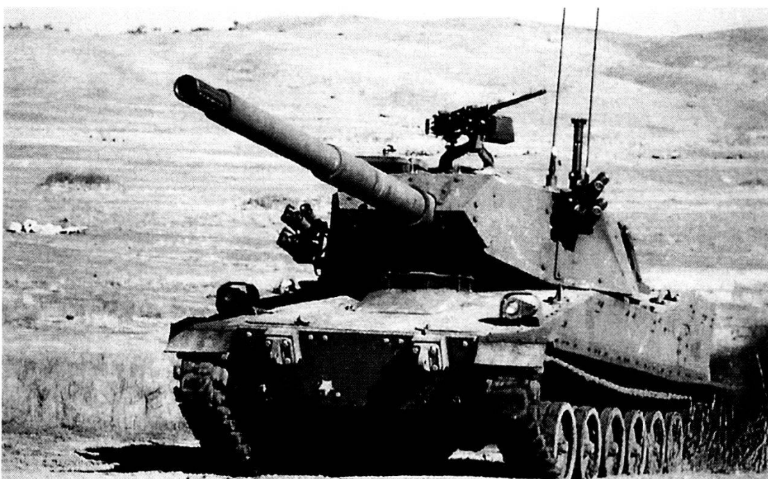
Semovente XM8 AGS (Armoured Gun System).

Da questo insieme di principi di partenza si costruisce il nuovo modello di alian-