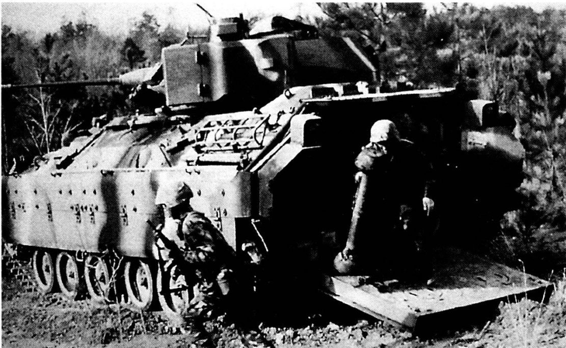
Carro armato «Leclerc» dell'Armée de Terre francese.

degli impegni e una sua dimensione politica a premessa di ogni pianificazione militare. Il controllo delle crisi diventa il principio cardine di tutta l'architettura del progetto di sicurezza europeo nel quale la partecipazione anche dei Paesi dell'Est ne è preconditione essenziale per un'efficace opera di costruzione. L'aver scelto, nel recente 1994, la formula del «partenariato», seppur nella sua provvisorietà terminologica, si è dimostrata un'obbligata via diplomatica di compromesso con l'obiettivo di tener conto delle aspirazioni degli aderenti, e, nello stesso tempo, motivo per non alterare la suscettibilità di Mosca, in attesa di una chiarificazione democratica interna e di incontrovertibili segnali circa le linee guida della politica estera del Cremlino. Ventidue Paesi nati, o rinati, dalla frammentazione dell'Unione Sovietica e dalla fine del sistema satellitare del Patto di Varsavia, rappresentano una dimensione politica istituzionale interessante dove, aumentando i centri decisionali europei, si rende necessario un coordinamento più concreto e allargato in termini di politica della sicurezza; coordinamento che dovrà completarsi proprio con il superamento della formula del partenariato. Se da un certo punto di vista la scelta della « Partnership for Peace » poteva essere concepita come una opportuna disponibilità verso la Russia, fortemente caratte-