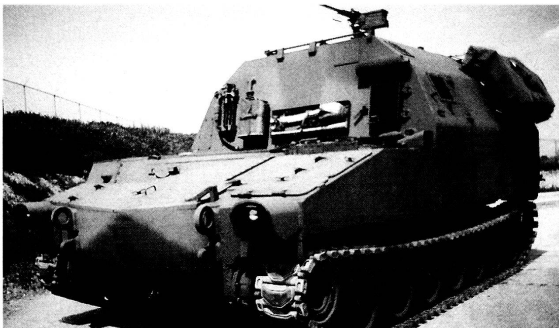
Cingolato statunitense M992 FAASV (Field Artillery Ammunition Support Vehicle).