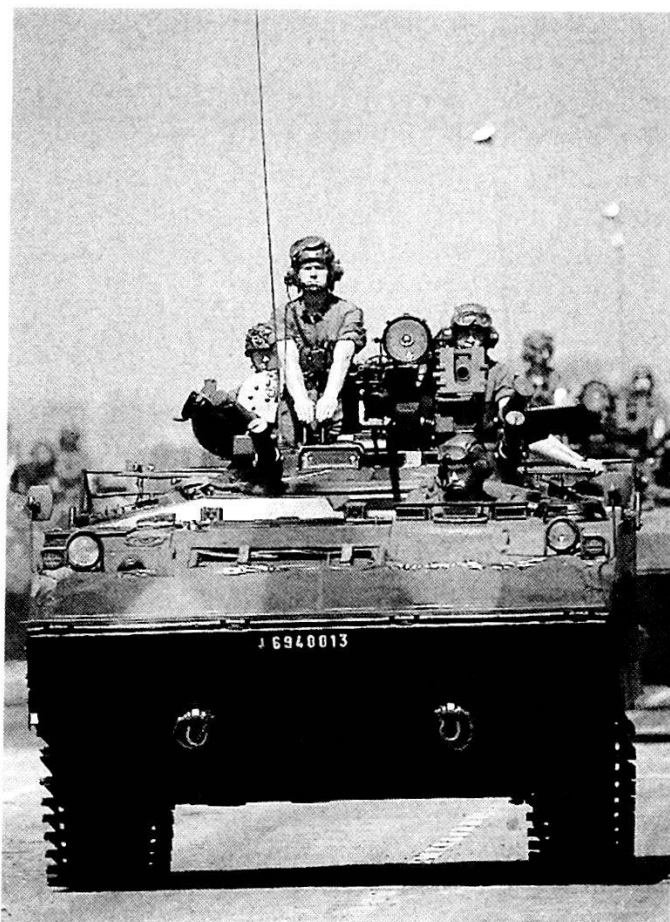
I blindati in dotazione alla Forza di Azione Rapida francese comprendono l'AMX 10 ruotato.

Bisognerà dunque ricorrere a soluzioni sostitutive alle quali si potrà utilmente aggiungere il concetto delle JCTF.