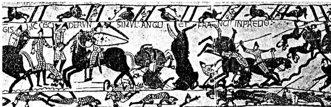
Cavalieri contro fanterie (Arazzi di Bayeux).

Con l'utilità che il mestiere delle armi procurava crebbe il numero di coloro che volevano dedicarvisi. Sovente inoltre si riunirono numerose compagnie di ventura, previ accordi tra i loro capi, a costituire degli eserciti, per quei tempi, di notevole mole, decine di migliaia di uomini, fanti e cavalieri con ausiliari per le retrovie e l'approvvigionamento. Questi complessi armati adottarono, ad esempio in Italia, metodi di combattimento con schieramenti su più linee, con riserve e servizi di esplorazione e collegamento. Rimaneva però assai difettosa la base etica di tali armate di ventura le quali non furono evidentemente guidate da una finalità superiore e che si volsero quasi sempre laddove poteva essere maggiormente pingue il bottino e più generoso il soldo.