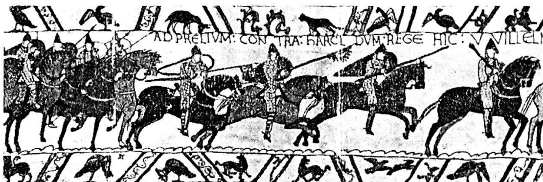
Cavalieri che partono all'attacco.

L'ambiente favorevole per il loro propagarsi fu creato essenzialmente dalle discordie intestine nelle quali degenerò la vita dei feudi e dei comuni. Quando le fazioni avverse si disputarono il potere e dei dissensi approfittarono i più audaci per impossessarsene, per cercare di abbattere l'autorità del comune e fondare sulle sue rovine la signoria di una famiglia, le milizie comunali, in quanto s'identificavano con i cittadini, parteciparono anch'esse alle lotte interne e si divisero tra le fazioni in lotta, ciascuna delle quali per sopraffare l'altra ricorse anche abbondantemente all'aiuto di venturieri mercenari. L'apporto delle compagnie di ventura rappresentò un elemento prezioso di preponderanza, soprattutto per la loro superiorità nell'addestramento e per la brutalità militaresca con la quale esse si resero temibili. Giova notare che le milizie mercenarie ebbero prevalente funzione regia in contrasto con le milizie feudali.