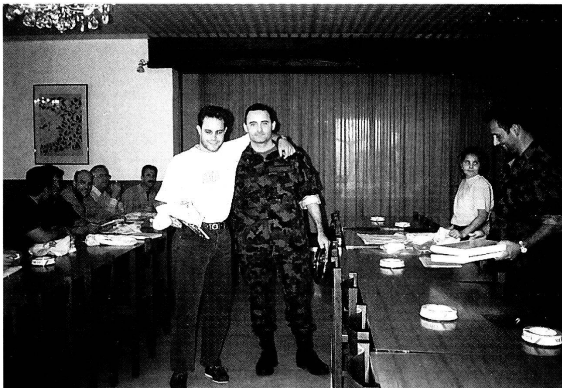
I vincitori alla premiazione.