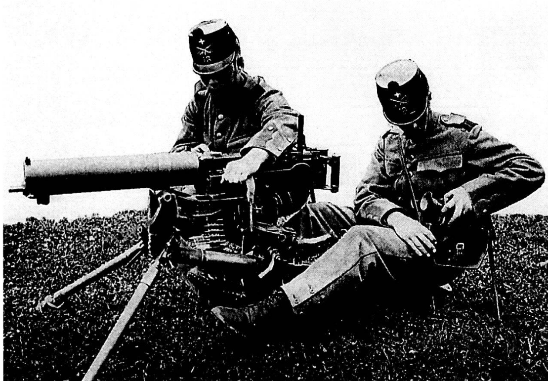
Mitragliatrice modello 1911.

Esse comprendevano gli artiglieri di fortezza (cannonieri ed osservatori), i «Maschinengewehr-Schützen» (che divennero a partire dal 1902 «mitraglieri») e le unità «compagnie di mitraglieri di fortezza», vale a dire nella nomenclatura originale «Fest. Mitr. Kp. 1» e «Fest. Mitr. Kp. 2», poiché si trattava di cp composte unicamente da militi di lingua tedesca.