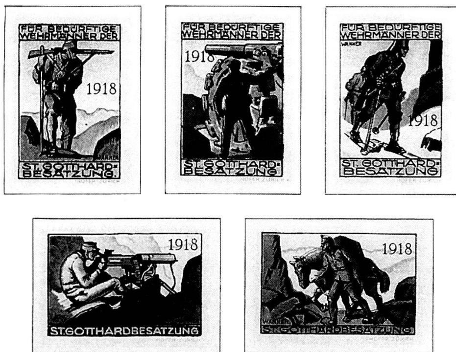
«Francobolli dei soldati» di alcune truppe della guarnigione del San Gottardo» (dalla collezione dell'autore del presente articolo).

L'ordine di battaglia 1912 della guarnigione della fortezza del San Gottardo, tenendo conto della riorganizzazione dell'anno precedente, menzionava la «Fest. Mitr. Abt. 1» con le «Fest. Mitr. Kp.» 1, 2, 3, 4 e la «Fest. Mitr. Abt. 2» con le «Fest. Mitr. Kp.» 5, 6, 7, 8, quest'ultima, come la 4 di Landwehr.