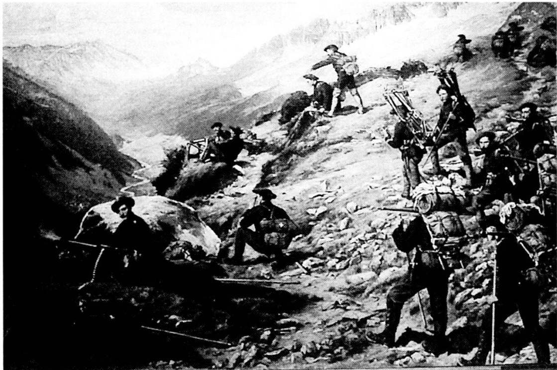
«Una batteria Maxim al San Gottardo, 1896». Riproduzione del dipinto ad olio di J.K. Kaufmann (l'originale si trova al museo del Vecchio Arsenale di Soletta).

Il 13 febbraio 1885, la Confederazione prende la decisione di fortificare il San Gottardo, iniziandone ancora nel medesimo anno la pianificazione per l'armamento, la costruzione, la scelta e l'entità delle truppe che dovevano formare la guarnigione propriamente detta, come pure fissare gli altri corpi di truppa che dovevano partecipare alla difesa del bastione del San Gottardo, il tutto secondo il concetto tattico globale di difesa del fronte Sud, elaborato in precedenza dallo SMG.