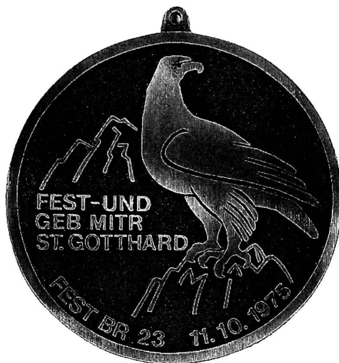
Targhetta commemorativa dei «Mitraglieri del San Gottardo» grandezza naturale, in bronzo (dalla collezione dell'autore del presente articolo).

Da notare che, in seguito allo scoppio della Prima guerra mondiale '14-'18, a partire dal 1915, la mitragliatrice modello 1911 fu fabbricata sotto licenza del nostro Paese. All'inizio del servizio attivo, nel 1939, ci si ricordò ancora delle vecchie Maxim modello 94, poiché, non avendo a disposizione a sufficienza mitragliatrici modello 1911, ne furono attribuite 42 a dei battaglioni territoriali!