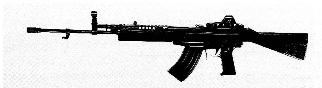
1973 W+F Weize Uno/SG 75 calibro .223 (5,56 mm).