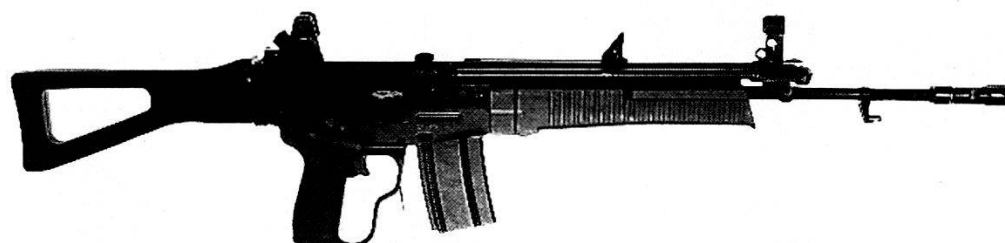
1982 W+F Weize C42 (fucile d'assalto) calibro 5,6 mm.