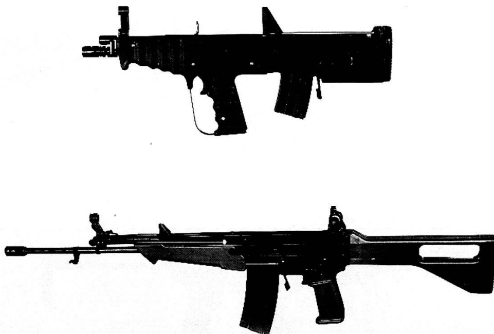
W+F Weize C23 calibro 5,56 mm.

A partire dal 1977, l'allora Fabbrica di munizioni di Thun (Munitionsfabrik Thun, M+F), in collaborazione con il Polverificio di Wimmis (Pulverfabrik Wimmis, P+F), sviluppò, per i nuovi fucili d'assalto, una nuova cartuccia 6,35 mm NSK