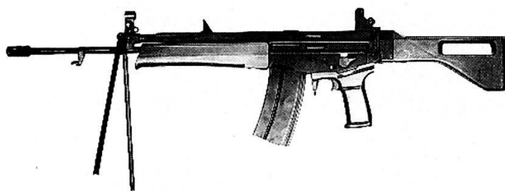
1980 W+F Weize E1 calibro 6,45 mm.

Sempre nel 1977, in occasione di prove svolte a Kiruna (Svezia), la W+F, con i suoi primi prototipi, ottenne risultati molto buoni nel confronto con la concorren-