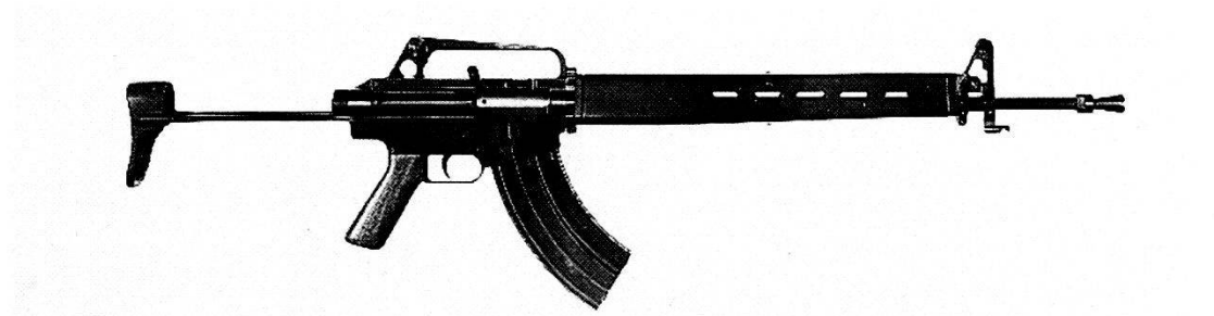
1970 W+F Stgw 70 Var II calibro 5,6 mm.

Nel 1970 l'Aggruppamento dell'armamento (ADA) propose al Parlamento lo sviluppo di un'arma portatile leggera e maneggevole per determinate truppe dell'esercito svizzero. Tale proposta venne accolta nel 1971 come priorità di livello 2, cioè sviluppo «al risparmio». Furono assegnati mandati di sviluppo sia alla Società Industriale Svizzera (SIG), che poteva fondarsi sul già collaudato fucile