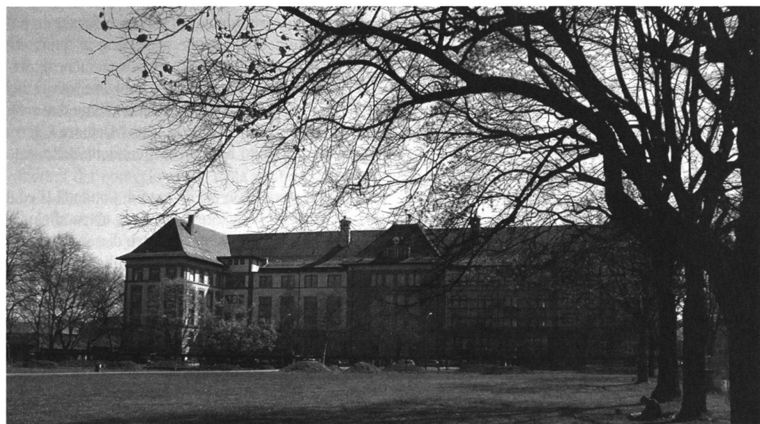
La caserma Mezener di Berna dove avrà sede la Scuola di Condotta Unità.

Con esercito XXI l'istruzione degli ufficiali di tutte le armi prevede un periodo di istruzione generale di 7 settimane, seguito da un Corso Aspiranti Ufficiali di 14 settimane presso le formazioni d'addestramento secondo l'incorporazione dei singoli militi, quindi un corso centralizzato di 7 settimane presso Scuola di Condotta Unità ed infine una Scuola Ufficiali di 14 settimane ed un periodo d'istruzione nel quadro dell'unità di 8 settimane di nuovo presso le formazioni d'addestramento.