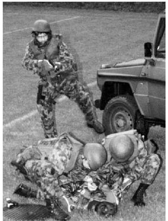
Sequenza di un esercizio

Il capo nella sua accezione generale può (deve) svolgere diversi ruoli. Il ruolo del capo è contraddistinto da prese di decisione, data d'ordine e di condotta. Parallelamente però è anche un allenatore (vedi la fase della preparazione del reparto).