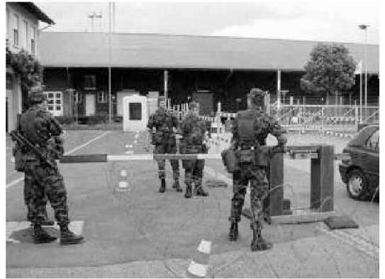
Il capogruppo allena e prepara la sua formazione

L'esercizio. La prova! Questa fase per ogni capo esercitato è un grande momento; il momento! Dopo un auspicabile