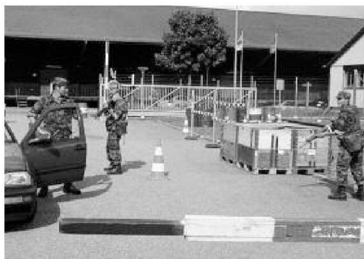
Sequenza di un esercizio

Siete più metodici? Il metodo dell'acqua fredda non vi