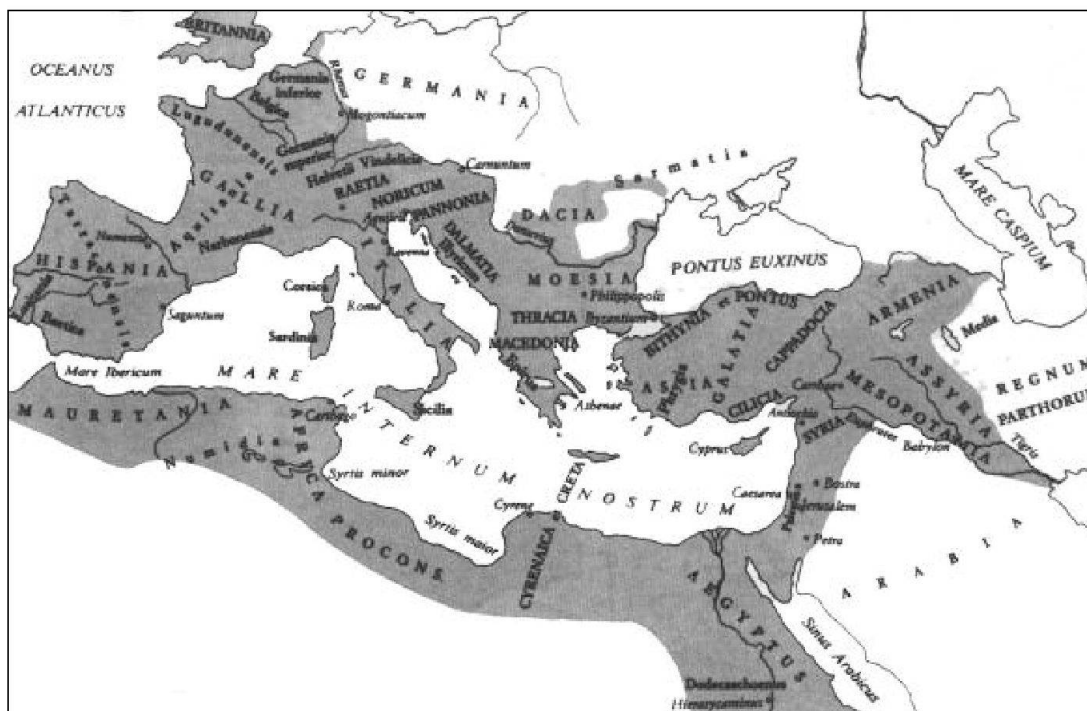
L'impero romano al periodo della sua massima espansione sotto Traiano (117 d.C.)

Da: Giuliano Martignetti (a cura di): Cronologia Universale. La storia, i fatti e i personaggi dalle origini a oggi , Torino 2002, p. 1031.