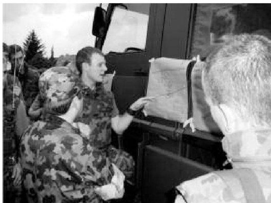
Presentazione del progetto di una presa di un settore.