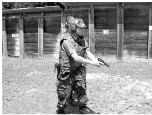
Istruzione al tiro con la pistola.