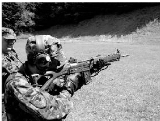
Istruzione di tiro con il fucile d'assalto.

Settimanalmente siamo stati inoltre confrontati con specifici esercizi (generalmente della durata da uno a tre gior-