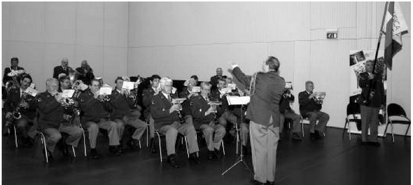
La Musica militare ticinese ha condecorato la cerimonia, inframmezzando ai momenti ufficiali note musicali particolarmente apprezzate.

Vi ringrazio per la vostra attenzione e specialmente per la vostra disponibilità di servire nell'Esercito svizzero. Grazie.