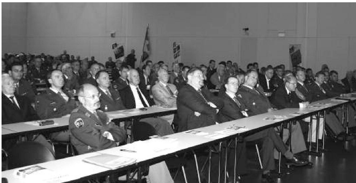
Veduta dell'Aula Magna dell'Accademia di architettura a Mendrisio dove si è svolta l'assemblea STU. In prima fila a destra gli invitati presenti.