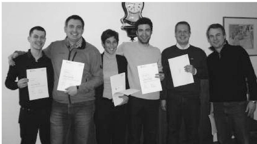
Giudici istruttori e aspiranti GI con il diploma appena ricevuto.

4 A tal proposito, in relazione al Canton Ticino, può essere interessante la lettura del libro di Fausto Cattaneo "Comment j'ai infiltré les cartels de la drogue", Parigi: Albin Michel, 2001.