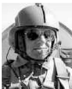
I ten Jeanpierre Mini

Intervista al Colonnello Tiziano Ponti, capo della base aerea di Locarno