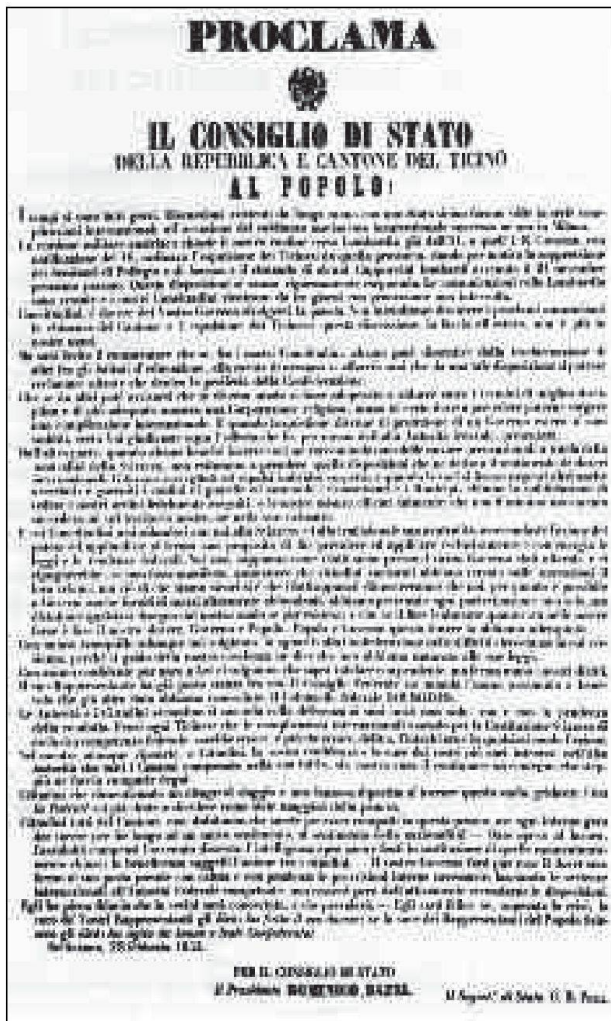
Proclama del consiglio di Stato al popolo ticinese, 22 febbraio 1853