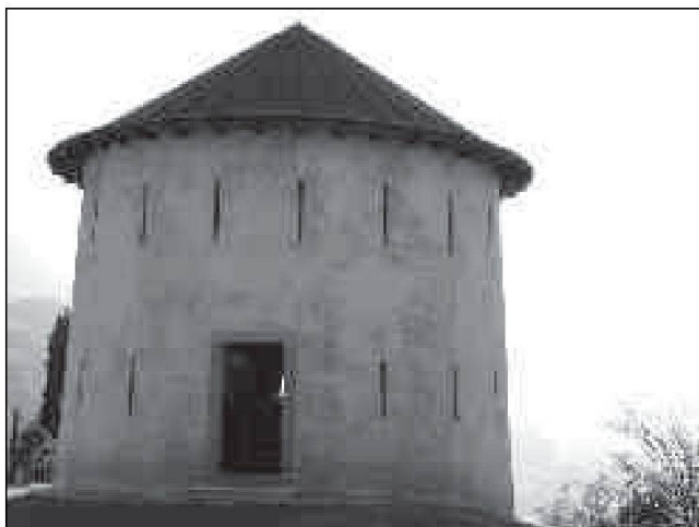
Camorino / Ai Scarsitt