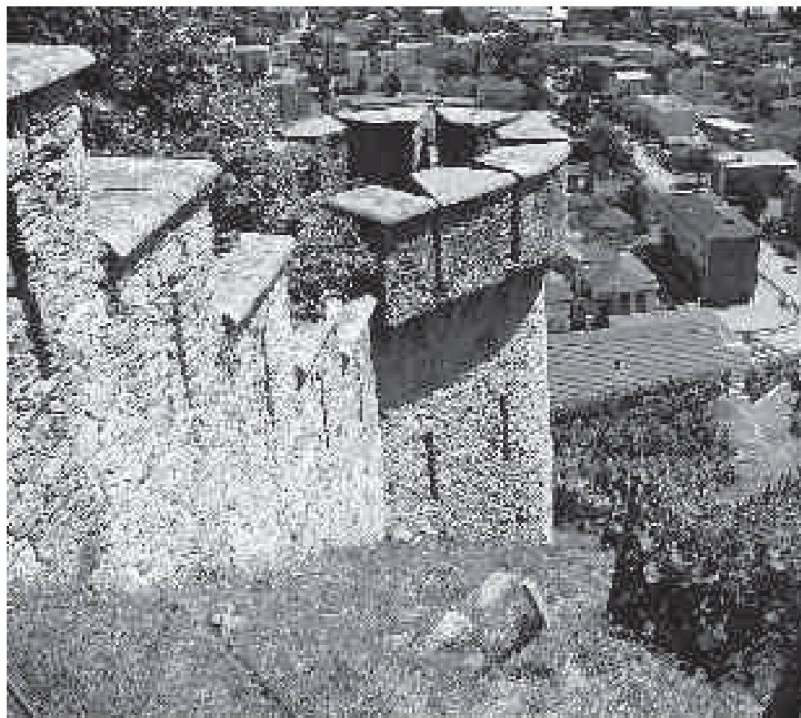
Scorcio della murata