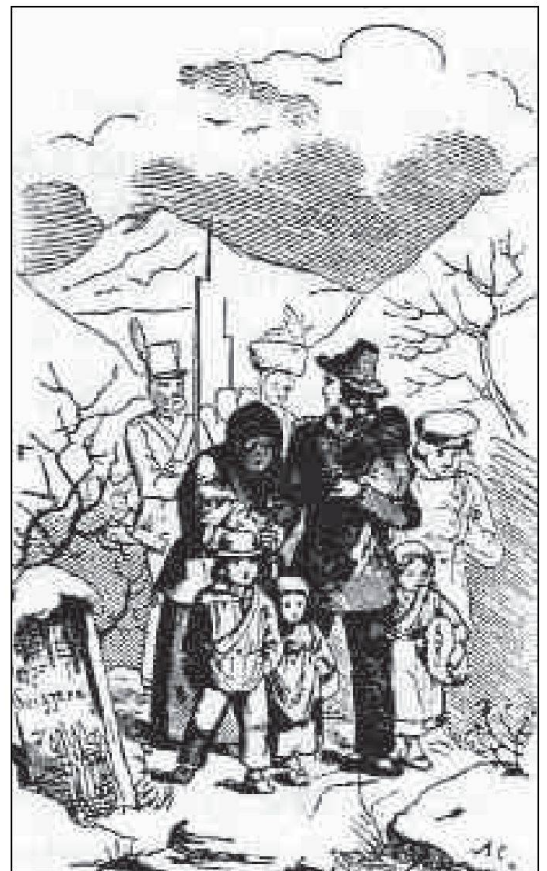
Cacciata dei ticinesi dal Lombardo-Veneto