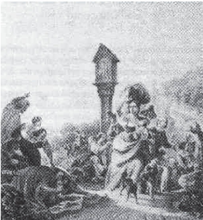
Cacciata dei ticinesi dal Lombardo-Veneto

Nel 1854 dopo trattative piuttosto lunghe, una delegazione svizzera riuscì a trattare con l'Austria, convincendola infine a porre termine al blocco della fame.