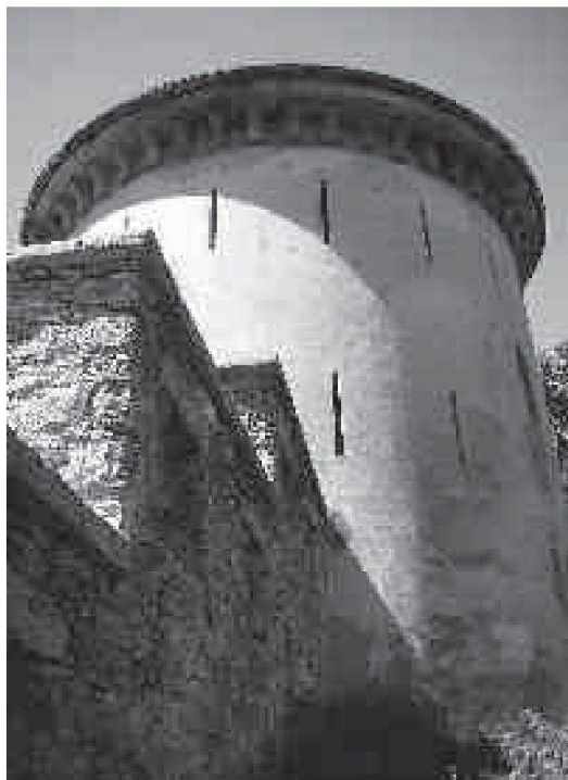
Sementina / Torre Pizzorino