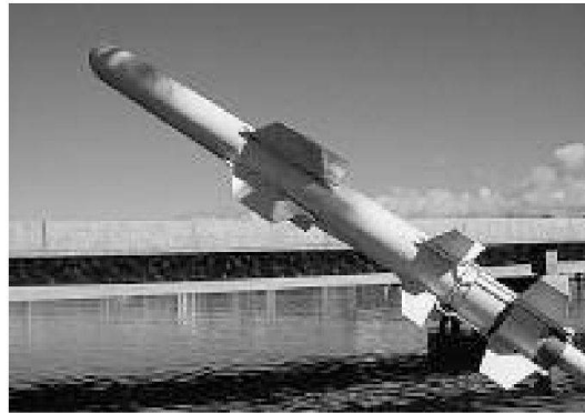
Il missile antinave HARPOON Block II

La fornitura di queste armi ha un valore complessivo di quasi $ 6.4 miliardi, il 98% del quale andrà a favore di un rafforzamento della difesa dello spazio aereo di Taiwan.