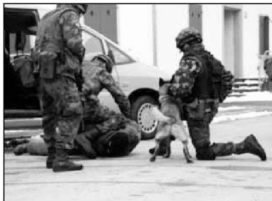
Rivoluzione culturale nell'applicazione della forza militare

TESTO COL SMG ALEX REBER E TEN COL SMG CHRISTOPH ABEGGLEN, SOST CDT CORSI DEL CAFT TRADUZIONE E ADATTAMENTO TEN COL SMG STEFANO BRUNETTI