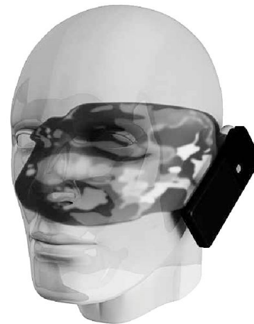
Succede nel vostro cervello quando telefonare

Tutti quanti vogliamo poter avere sempre la possibilità di comunicare, navigare in internet o più semplicemente telefonare ma per fare questo ci vogliono delle antenne. E un principio semplice: più antenne sul territorio=migliore copertura e potenza di emissione ridotta per comunicare dunque minore pericolo per la salute. Adesso, se un bel giorno un operatore di telefonia mobile bussasse alla vostra porta per chiedervi di piazzare un antenna sul vostro tetto, non esitate! Questo per 3 ragioni: 1) è sempre un'entrata in più nel bilancio familiare 2) avrete un segnale sempre ottimo dunque minore radiazioni e potenza per le chiamate 3) un antenna di telefonia mobile emette orizzontalmente su qualche chilometro ma verticalmente solo poche decine di metri se non addirittura pochi metri. Non aspettare che sia il vicino di casa, dopo aver letto questo articolo, a piazzare quell'antenna sul proprio tetto... ■