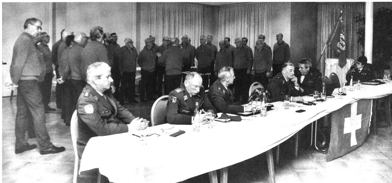
I Cantori delle Cime ed il Comitato