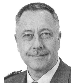
cdt C André Blattmann

COMANDANTE DI CORPO ANDRÉ BLATTMANN, CAPO DELL'ESERCITO