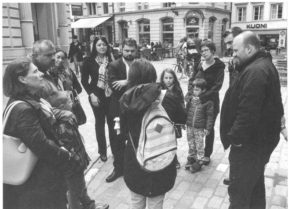
Visita della città