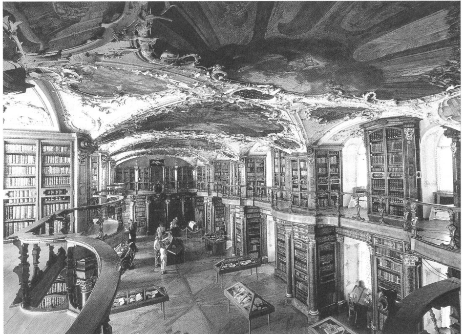
La sala barocca della biblioteca abbaziale, Abbazia di San Gallo Patrimonio-UNESCO

In questo luogo è conservato il Codex Abrogans, probabilmente il più antico testo in lingua tedesca esistente contenente il primo Padre Nostro in tedesco. ■