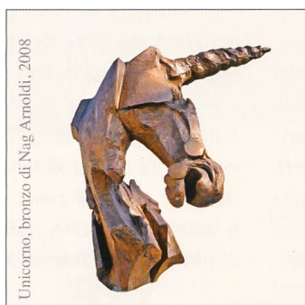
Unicorno, bronzo di Nag Arnoldi, 2008