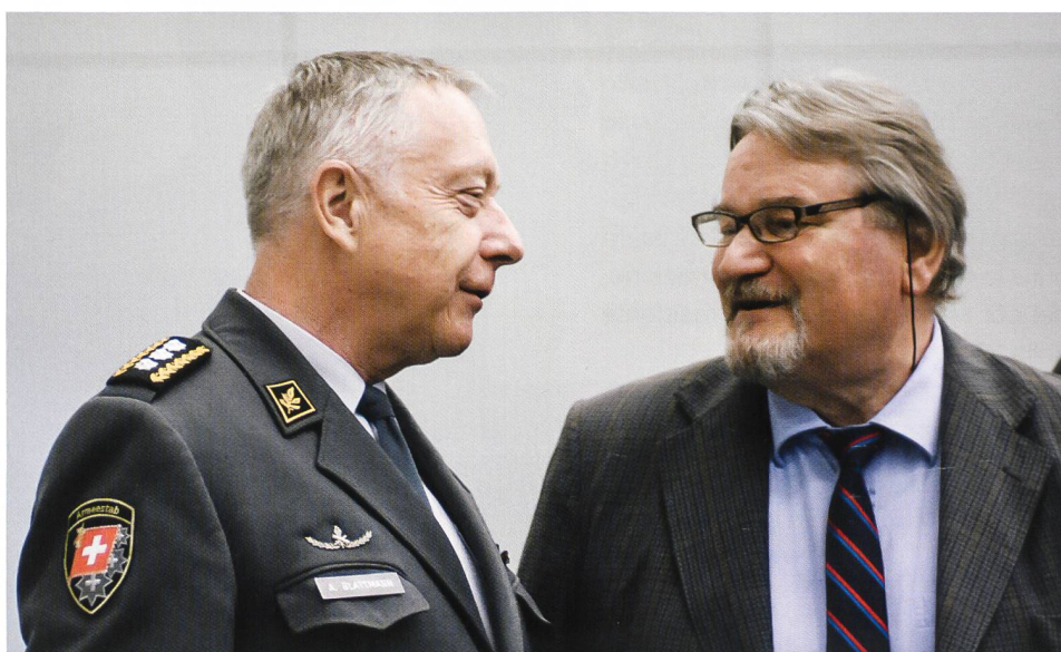
In alto: la sala si riempie A destra: il capo dell'Esercito e il Presidente della FTST Sotto: il pubblico in sala