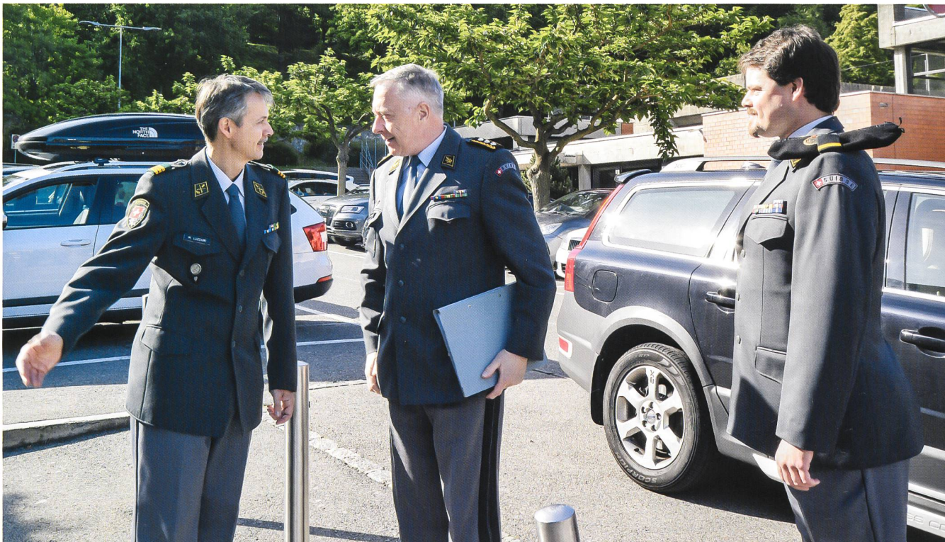
Benvenuto signor comandante di corpo