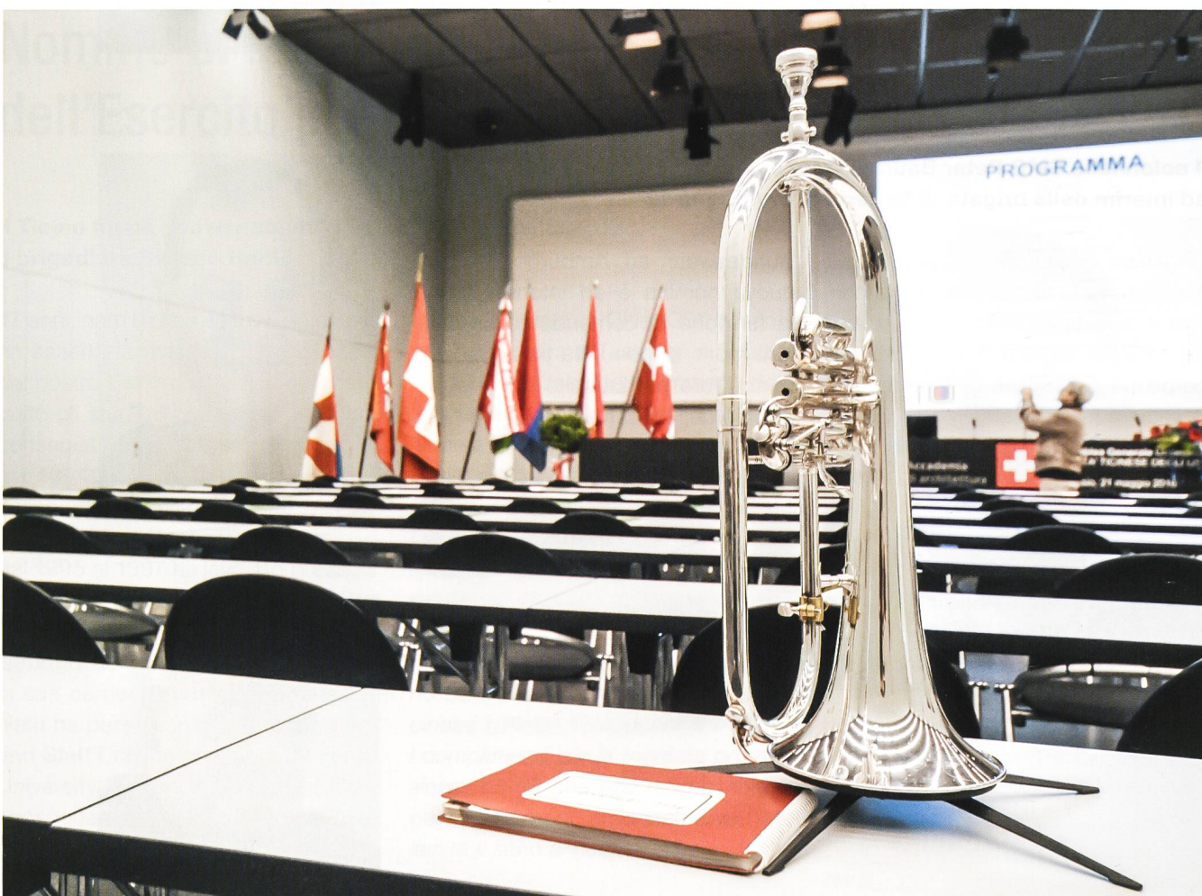
Tutto pronto, si può iniziare