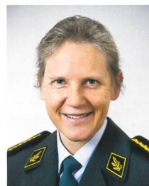
brigadiere Germaine Seewer

È risaputo che il personale è la risorsa più importante di un'organizzazione. Con l'avvio dell'USEs, il 1° gennaio 2018 l'esercito verrà trasferito in una nuova struttura di condotta. Gran parte degli stati maggiori e dei corpi di truppa viene ristrutturata, sciolta o costituita ex novo. Nel contempo, viene modificato il modello d'istruzione e di servizio e vengono introdotte nuove basi legali. Il trasferimento del personale di milizia rappresenta un progetto di ampia portata e un dossier d'importanza fondamentale nell'ambito dell'USEs.