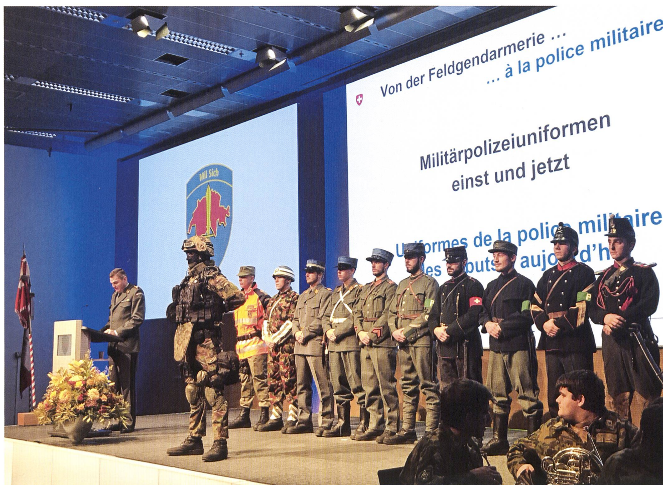
Da destra: Uniformi anno 1866, 1914, 1918, 1935, 1939, 1945, 1960, 1975, 1990, 2010 e 2017.

funzionante e riconosciuta”. Questo rapporto non è una fine, ma “un segnale di un nuovo inizio che guardiamo con curiosità, fiducia e senza timore, anche per quanto riguarda l'Ulteriore sviluppo dell'esercito”. ♦