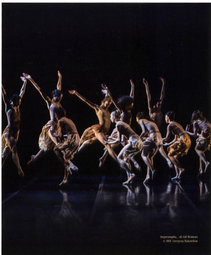
Impromptu... di Gil Roman © Bêjart Ballet Lausanne