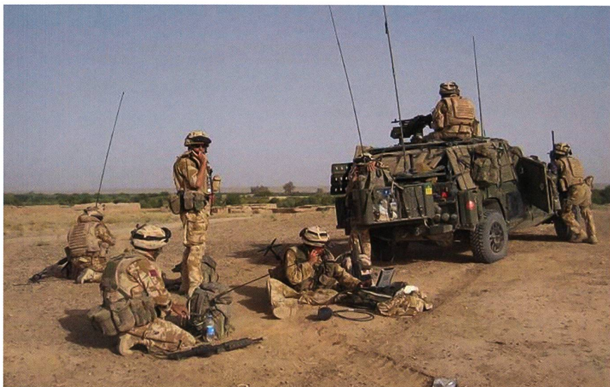
Un Joint Fires Support Team britannico in Afghanistan, con il comandante di tiro, l'ufficiale del controllo aereo avanzato e i loro aiutanti.

forze armate nonché da parte delle singole armi una definizione degli obiettivi ed elabora a sua volta una lista degli obiettivi che la cellula di targeting completa con le informazioni necessarie per combatterli. Tale lista contiene anche gli obiettivi vietati ( No strike list ) e una lista degli obiettivi con restrizioni. Il Joint Targeting Working Group si occupa di definire gli obiettivi prioritari e di assegnarne il combattimento alle rispettive armi.