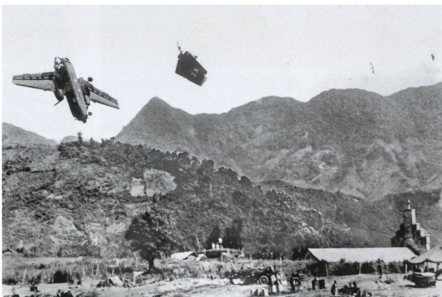
Mancanza di coordinamento dello spazio aereo: un C-7 Caribou statunitense abbattuto dalla propria stessa artiglieria. Ha Phan (Vietnam), 3 agosto 1967.