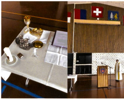
S. Messa di Pasqua nella palestra della caserma.

aprile il via libera per i congedi della SR è arrivato. Da lì in poi e fino al licenziamento del 15 maggio è stata tutta una strada in discesa.