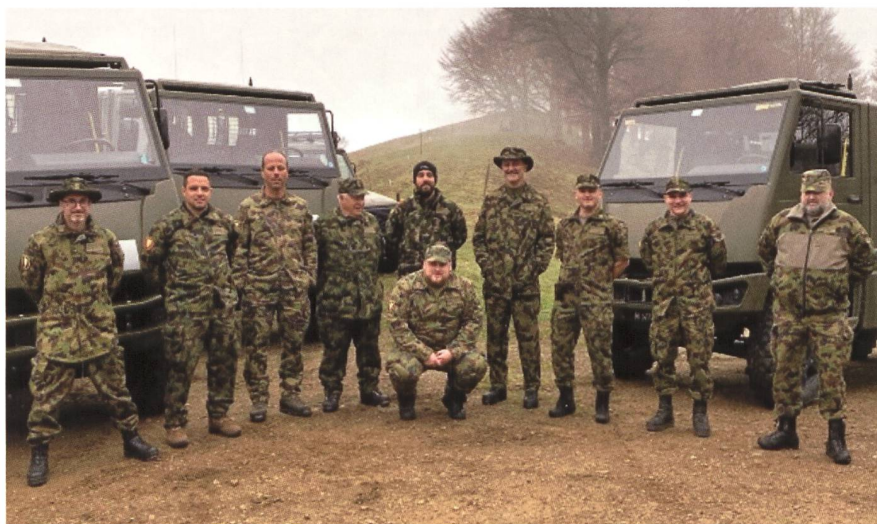
Una parte dei partecipanti al Corso, in posa e in azione.

classificati) e un ricco bagaglio di esperienza da spendere nell'organizzazione delle future gare ticinesi. Ecco uno stralcio della loro relazione: "la Gara si è rivelata una manifestazione molto interessante e variegata. Pianificata su una durata di circa trenta ore ben si capisce come all'importante attività di guida si siano alternati momenti di attività militare, di riposo e ristoro. La competizione vera e propria è iniziata alle 13.00 di venerdì 20 maggio e si è conclusa sabato alle 18.00 circa. Venerdì ci sono state prove nel pomeriggio e nelle ore serali-notturne, la cena in comune con relativa visita a un museo militare privato (che comprendeva innumerevoli pezzi della storia militare Svizzera) e il pernottamento in un accantonamento predisposto. Nel corso del sabato si sono svolte nuovamente missioni. Il pranzo è stato offerto allo stand dove si sono svolte le competizioni di tiro, le