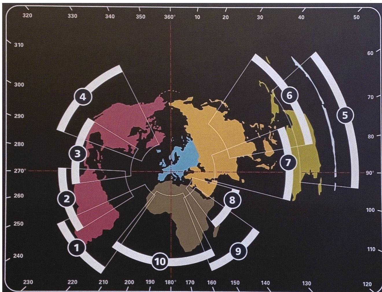
Esempio di settori di trasmissione OC sperimentati e collaudati sui quali si orienta l'antenna. In questo caso dalla stazione radio delle OC Svizzera (1932-2004).

Qui comincia con qualche soddisfazione quel desiderio che pocanzi le esprimevamo. Le chiedevamo di darci qualche senso, qualche esperienza del come Ella, e da quali agguati della