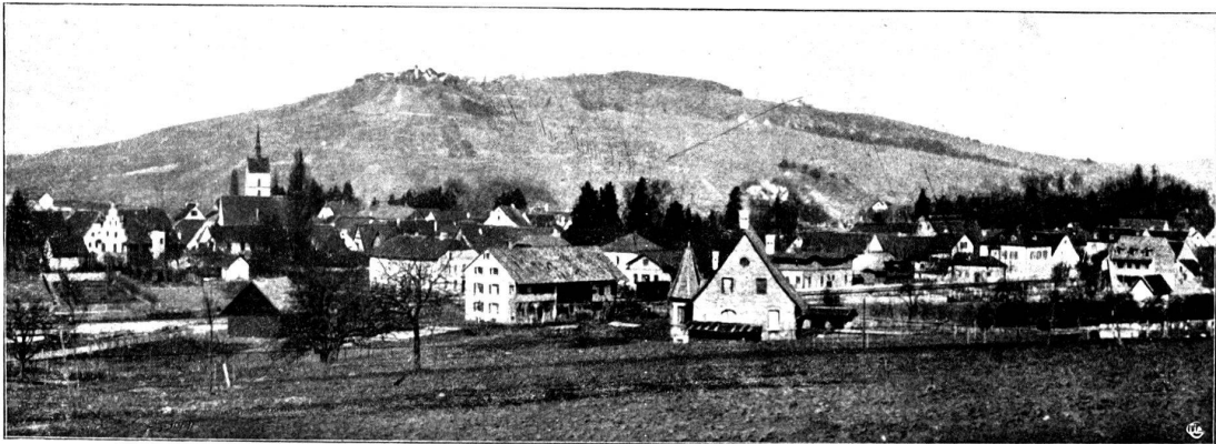
La colline de Tullingen.