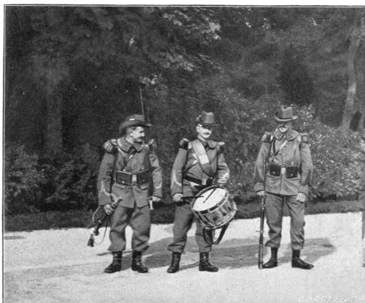
Nouvelle tenue de l'infanterie française en essai dans une compagnie du 28 e de ligne.