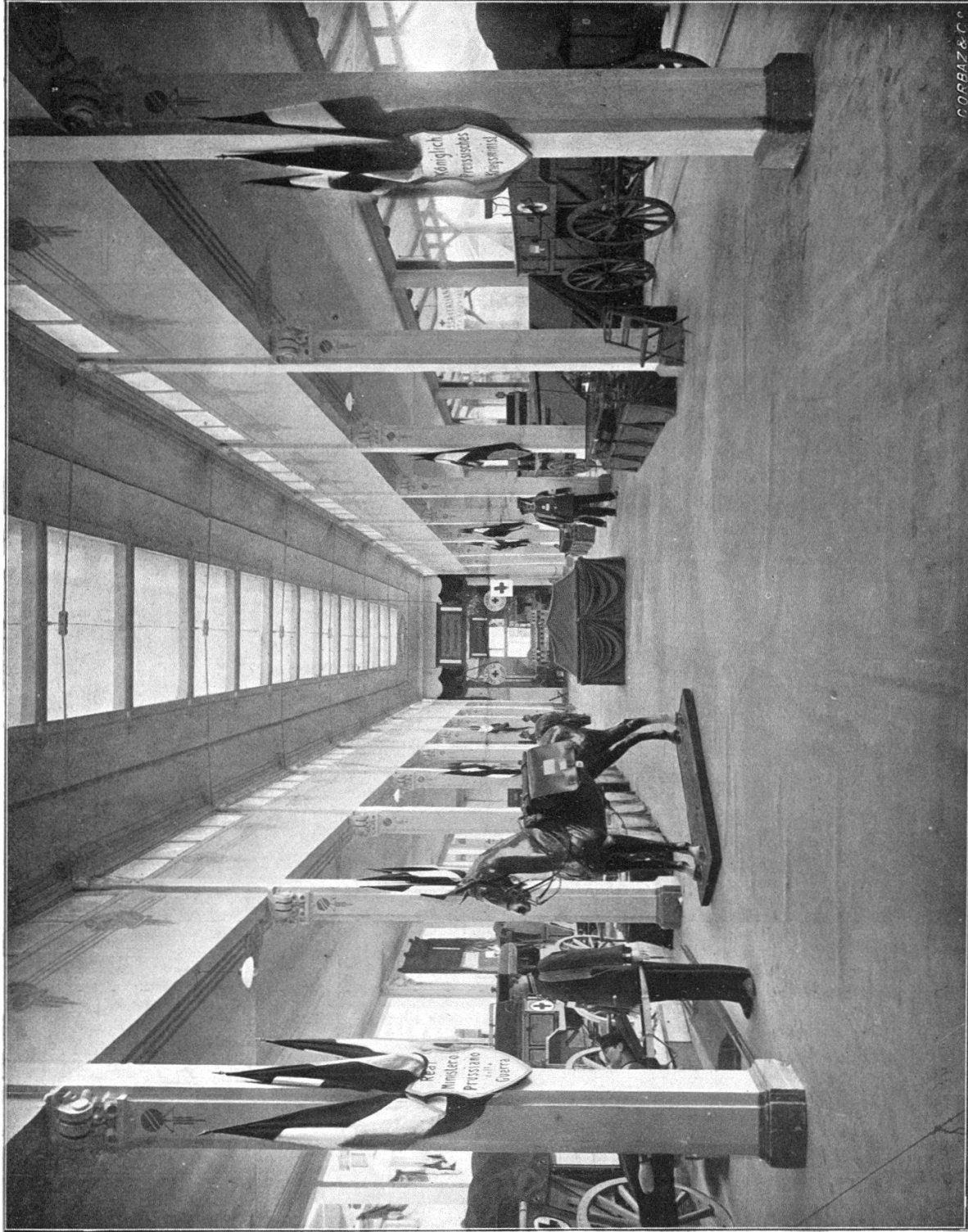
Exposition du Ministère de la guerre prussien.