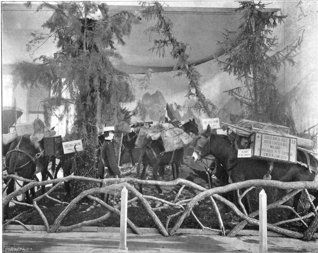
Ambulance de montagne.