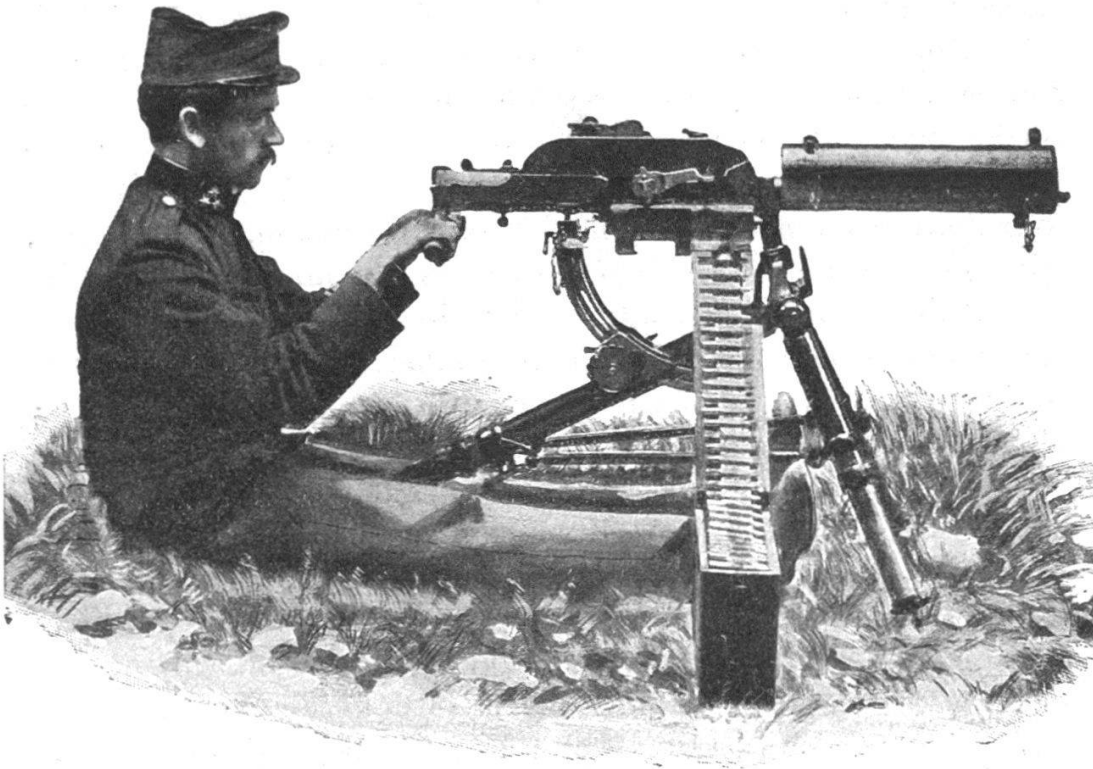
Fig. 1. — Mitrailleur Schwarzlose au tir, dans sa plus haute position.