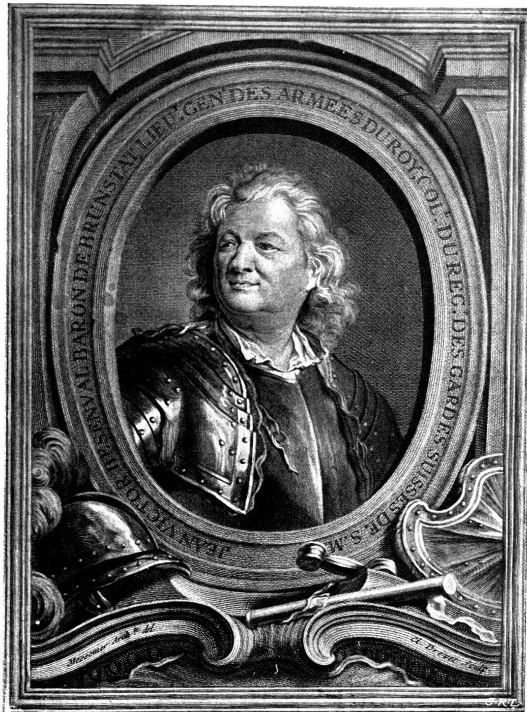
JEAN-VICTOR, baron de BESENVAL (Soleure)