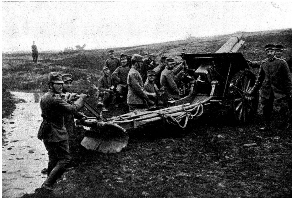
Obusier de 149 mm. du type Krupp.

En adoptant cette pièce nous avons cherché à avoir une bouche à feu d'une grande puissance jointe à une mobilité suffisante pour suivre les troupes, à peu près comme une pièce d'artillerie de campagne.