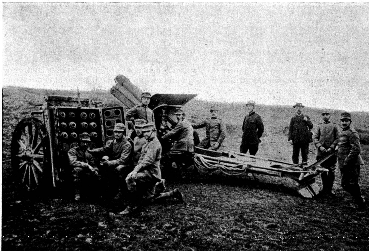
Obusier de 149 mm. du type Krupp.

La charge se fait séparément pour le projectile et pour la douille qui contient la poudre. Il y a cinq charges différentes, qui permettent d'obtenir une vitesse initiale variable de 160 à 300 mètres à la seconde.