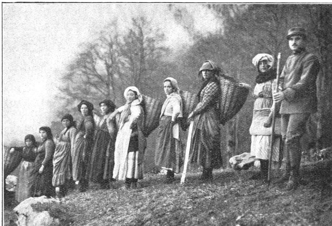
Un pittoresque convoi de ravitaillement.

La révolution française avait provoqué la tendance à se soustraire aux ordres des autorités dans toutes les régions italiennes gouvernées par des étrangers, généralisant l'aversion contre ces derniers qui, avant 1793, avait été ressentie seulement par des groupes restreints d'intellectuels. Lorsque l'Italie