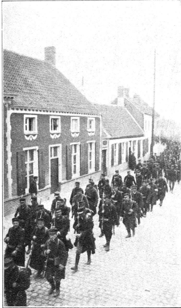
Un régiment allant aux tranchées. Marche à volonté.

Pendant la phase suivante, de fin août à octobre 1914, elle fut d'une grande utilité aux troupes anglo-