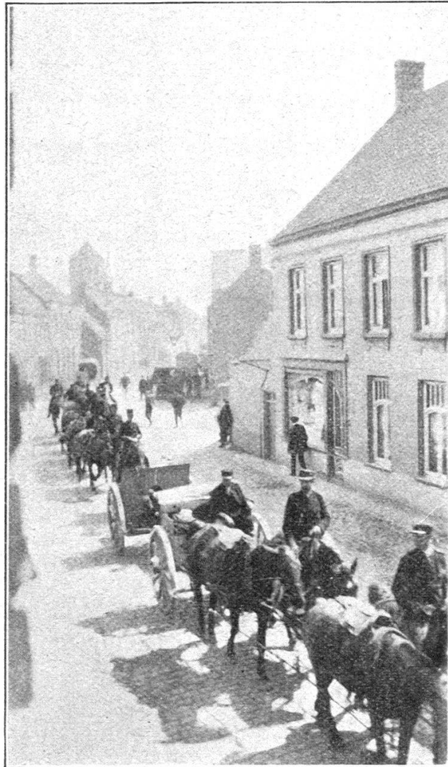
Artillerie belge allant prendre position.

aux forts les plus perfectionnés et les mieux armés, combien rapide fut leur fin dès qu'ils furent visés par la grosse artillerie de siège moderne. L'étude des fortifications de Liège, Namur et Anvers, l'étude détaillée de leur chute, sera intéressante et pleine d'enseignement pour l'avenir : nous n'avons pas à y insister ici.