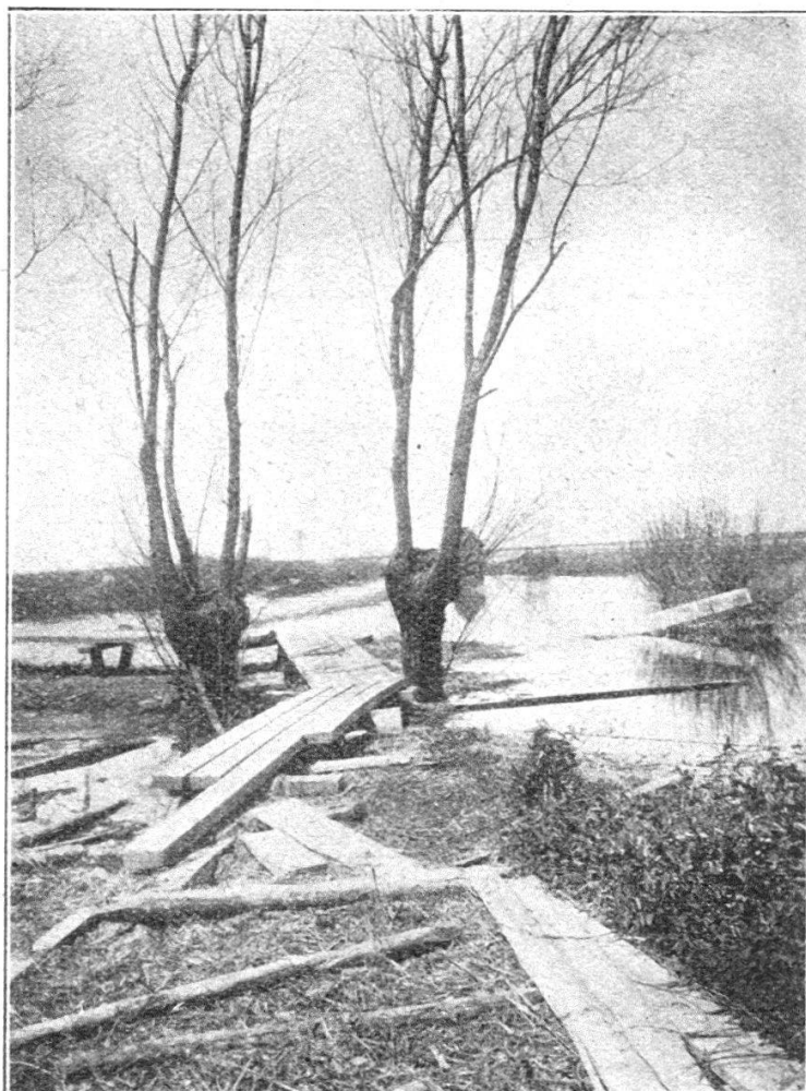
Chemin de colonnes à travers l'inondation.

En réalité, l'on était bien loin de s'en tenir à ces chiffres. Pour des raisons budgétaires et autres, les congés étaient quasi-obligatoires dans l'armée belge.