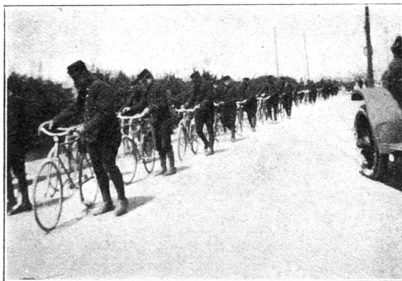
Une compagnie de carabiniers cyclistes.

Et, contre l'armée belge réduite alors à la moitié, à peu près, de ses effectifs du début, exténuée par cette longue lutte, par ses retraites en marches ininterrompues, pauvre en matériel de tout genre autant qu'en hommes, se lança la formidable armée commandée par le prince de Wurtemberg. Forte de